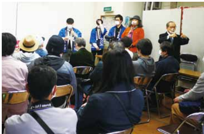
コンテスト授賞式で挨拶する高木理事長

コンテストの名称「ゆる鉄」の名称付け親、中井精也氏が全国から集まった応募写真の中から入選作品の