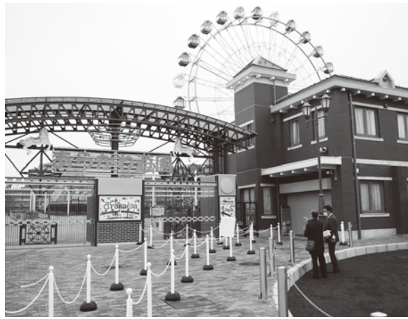
新しくなったあらかわ遊園入場ゲート

新しくなった「あらかわ遊園」を商店街で応援しよう！ 「チケ得サービス協力店」でお店のPRも出来ます。