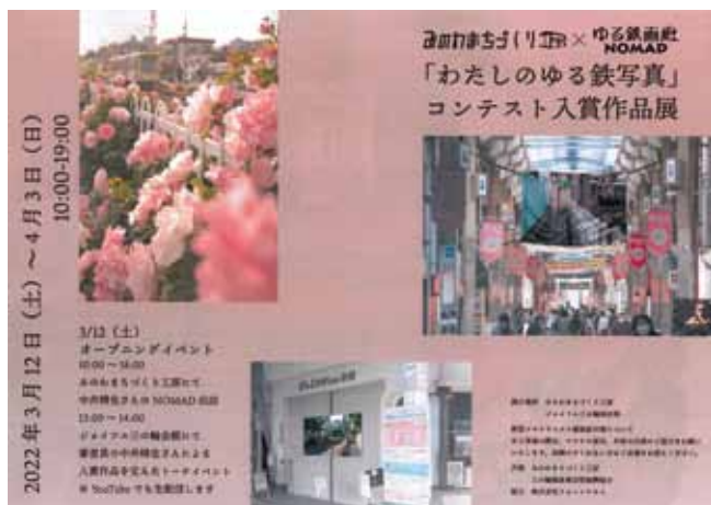
イベント告知のチラシ

講評と授賞式を開催した。 このイベントは三の輪商店街振興組合とみのわまちづくり工房が共催で行った。