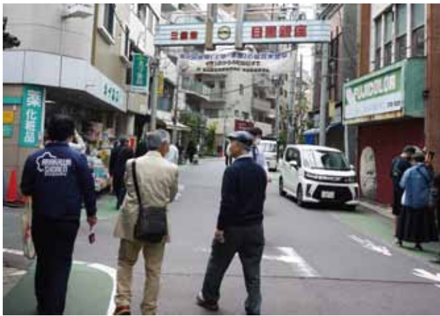
目黒銀座商店街を視察

都内の商店街状況と会員相互の情報交流や親睦を行い、区役所へ夕方5時に予定通り帰還した。