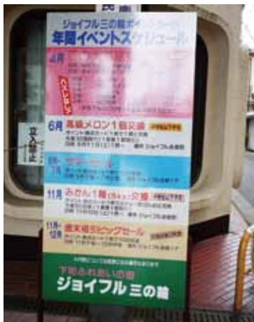
三の輪銀座商店街振組のイベント看板

三の輪銀座商店街振組は年間イベントスケジュールを商店街に大きな立て看板で案内し、通年のお得な情報を発信している。今回のスプリングセールは4月23日に終了、スクラッチカードの当選景品の引換えは5月12日・13日に実施した。