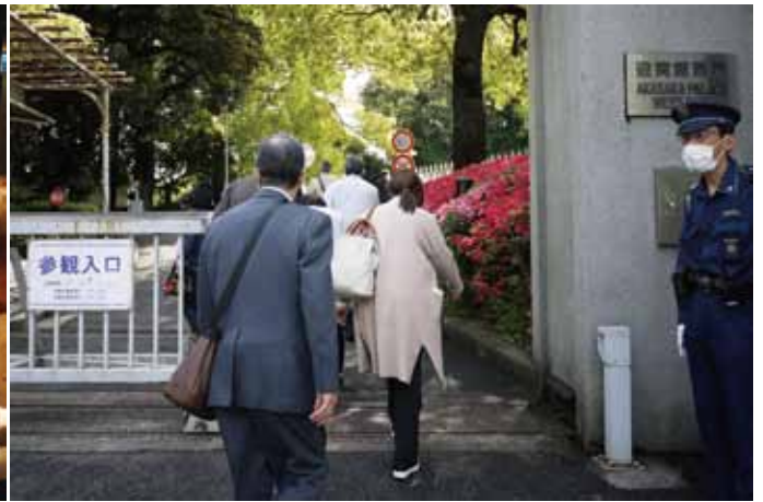
迎賓館赤坂離宮を入场見学