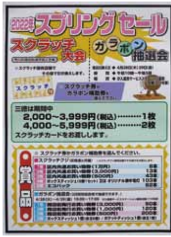
べるぼうと汐入商店街振組のチラシ

べるぼうと汐入商店街振組ではスプリングセールのスクラッチくじとダブルでガラポン抽選補助券を配布。スクラッチくじはお買い物したお店で当選品をその場で進呈。併せて4月28日・29日の両日に実施するガラポン抽選補助券も進呈した。