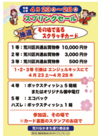
荒川なかまち通り商店会のチラシ

おぐぎんぞ商店街振組は商店街で毎月発行の夕市特番の売出しチラシ（左図参照）でスプリングセールを案内。ここでもスクラッチカード当選の景品引き換えを1等から3等は南進堂書店、4等以下はトミエストアーで行い当選景品の引換え業務を2ヶ所分担して実施した。