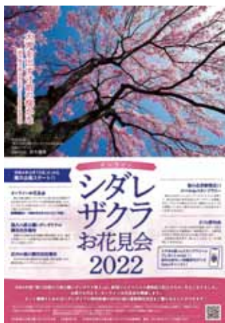
バーチャルイベントの告知チラシ

毎年恒例の尾久の原公園シダレザクラ祭りは、昨年に続き新型コロナウイルスの感染拡大防止ため中止となり、主催する尾久の原公園シダレザクラの会が「バーチャル・シダレザクラお花見会2022」のタイトルでネット開催された。 実施の内容はユーチューブの動画配信機能を使い、都立尾久の原公園のシダレザクラや荒川区内の桜の名所に加えて、荒川区の交流都市秩父のシダレザクラの満開の様子をドローン空撮も使用しライブで撮影、臨場感ある映像で見せた。 併せてネット配信期間中、サイトのクイズのキーワードに答え、ハガキやファックスの応募をすると秩父の名産等の豪華景品が当たるイベントも実施。