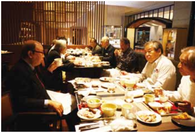
目黒雅叙園での懇親会風景