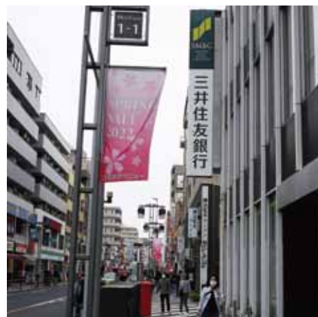
まちやアペニューのスプリングセールペナントとセールポスター