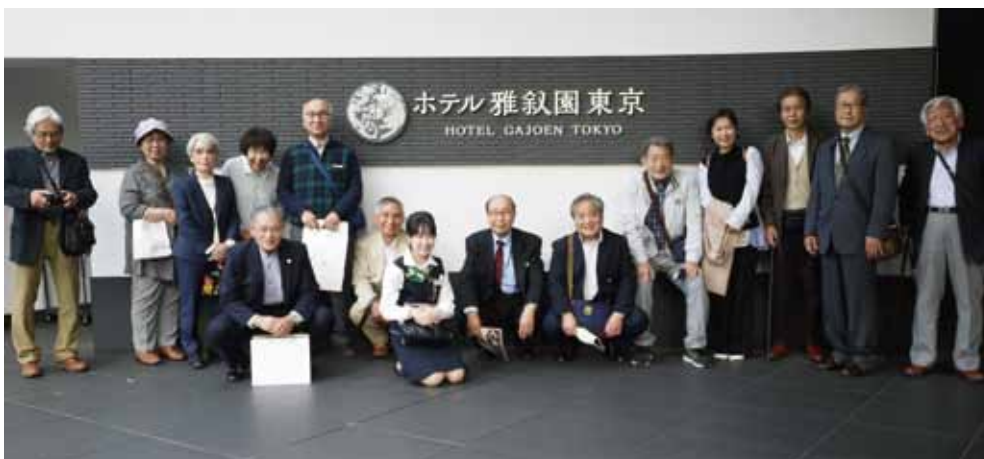
商店街視察研修会の参加商店街各位