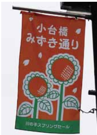
小台橋みずき通り商店会のペナント

区内商店街の街路灯等には各商店街の独自デザインペナントが掲示されている。小台橋みずき通り商店会には右の写真の赤をベースにひまわりがデザインされたスプリングセールのペナントが飾られた。