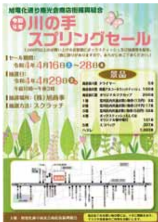
旭電化通り商光会商店街振組のチラシ

スプリングセールは新型コロナウイルス感染症対策のためイベントは中止、抽選会のみの実施となった。毎年GW中の4月29日に開催されていた荒川区商業祭と川の手荒川まつりも同様に中止となった。スプリングセール参加の各商店街はお買い物の際にその場で区内共通お買い物券が当たるスクラッチカードを進呈するイベントを開催。各商店街毎の期間（左下表参照）にそれぞれ的方式で実施した。