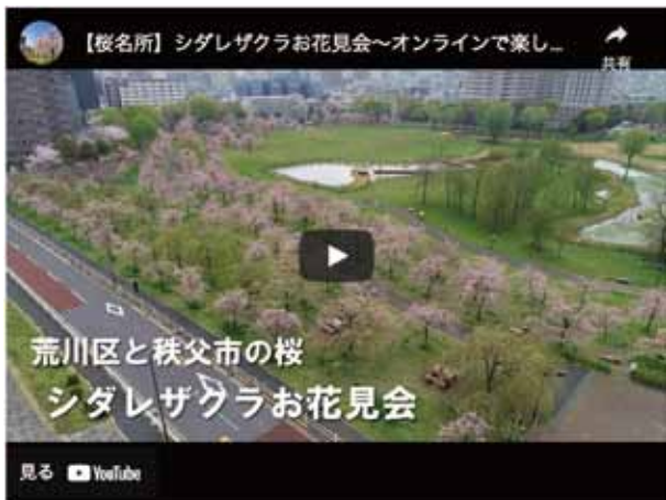
ネットの画面の一部

桜のライブ配信は第1回午前11時から第2回午後3時から各2時間の生配信したが、ライブ配信終了後もしばらくの期間、ユーチューブのアーカイブで見ることができた。