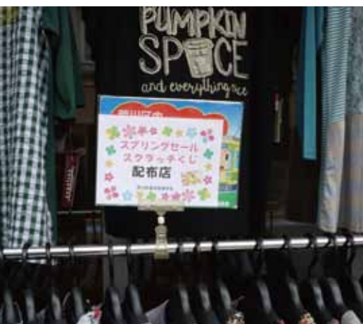
スプリングセールのスクラッチくじ配布店