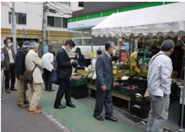
目黒銀座商店街の生鮮野菜店