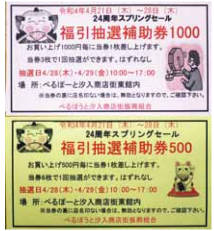
同時開催のガラポン補助券