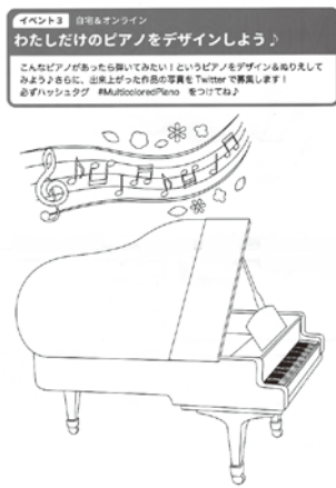
イベントPR用チラシと裏面の塗り絵