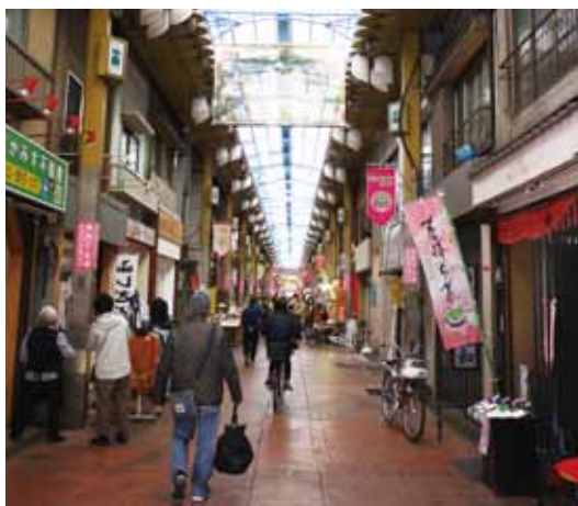
商店街アーケードや通りに入選作品を展示