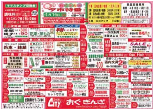
おぐぎんぞ商店街振組のチラシ

おぐぎんぞ商店街振組は商店街で毎月発行の夕市特番の売出しチラシ（左図参照）でスプリングセールを案内。ここでもスクラッチカード当選の景品引き換えを1等から3等は南進堂書店、4等以下はトミエストアーで行い当選景品の引換え業務を2ヶ所分担して実施した。