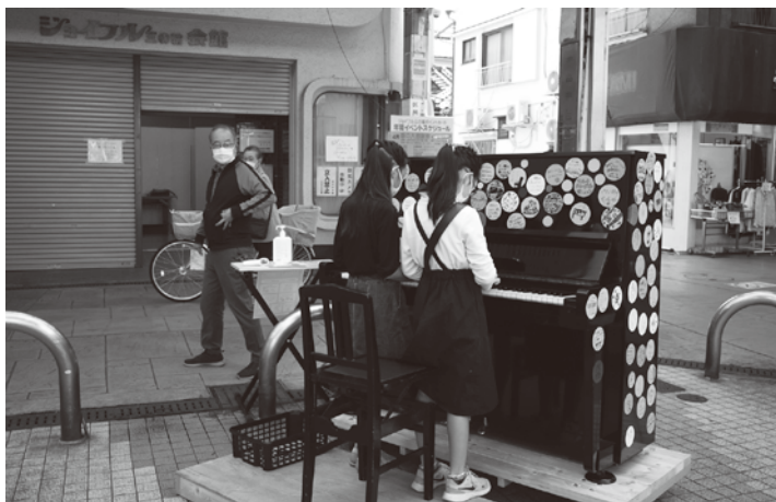
商店街会館前に置かれたストリートピアノで友だちと連弾で演奏

三の輪銀座商店街振組では昨年の暮れに続き、ストリートピアノのイベントを開催。 商店街に3台の誰でも自由に弾くことができるピアノを設置。ピアニストによるクラシック、ジャズ、ラテン、ポップスなど様々なジャンルのミニコンサートも開催した。 同時にインターネットで演奏会場からライブ放映も実施した。 またチラシの裏面にはピアノの塗り絵「わたしだけのピアノをデザインしよう」が描かれている。塗り絵を完成させた作品をツイッターを使って募集していた。