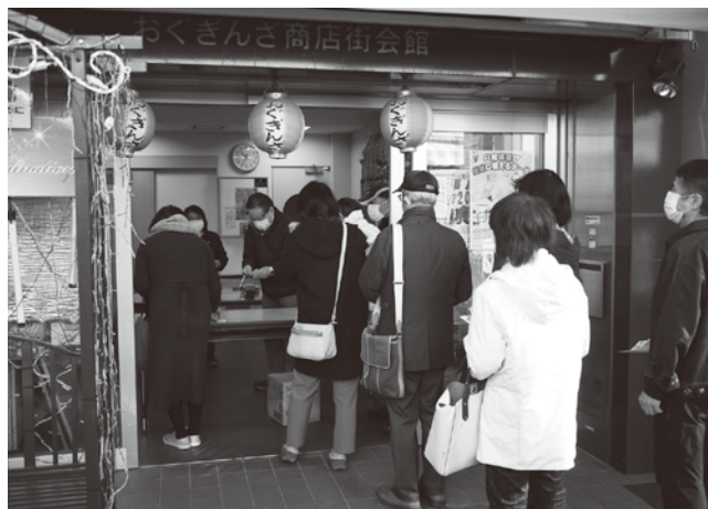
おぐぎん商店街の売場の様子

今回もハガキ・Web購入申込に 抽選方式での販売を実施!! 販売日に買えなかった人のため、前回同様、発売額2千万円分をハガキまたはWeb申込みで募集した。締め切りの12月3日までにハガキ及びWebの応募数は合計4千通近くあり、発売枠に対して約5倍の人気となった。事務局で厳正な抽選を行い、直ちに当選者に購入引換券が郵送された。 当選した交換券での販売はサンポップマチヤ1階で12月18日から20日の3日間実施、ハガキ・Web申込分2千万円分の区内共通プレミアム付きお買い物券は混乱無く販売された。