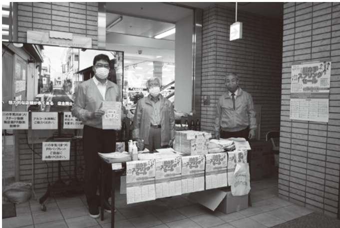
2021年4月、商業祭イベント(町屋駅前銀座商店街振組)