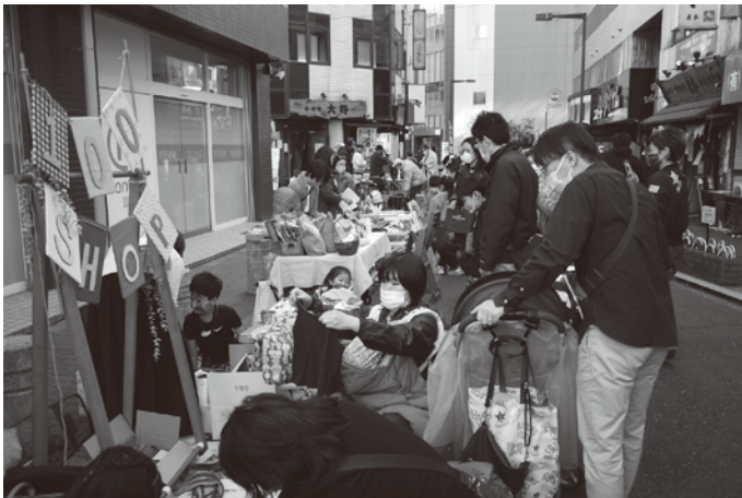
古着と子ども向けのマーケット