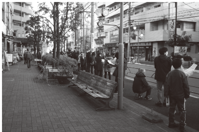
ちょっと、まちや(町屋駅前銀座)の発売前の行列