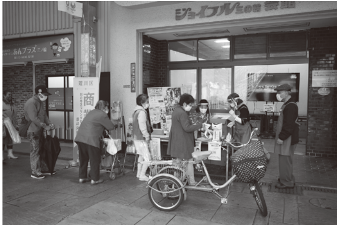
2021年4月、商業祭イベント(三の輪銀座商店街振組)