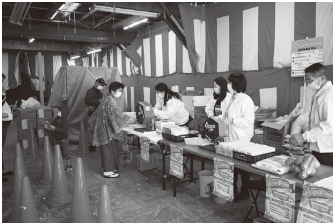
2021年10月、秋の収穫祭(荒川銀座商和会商店街振組)