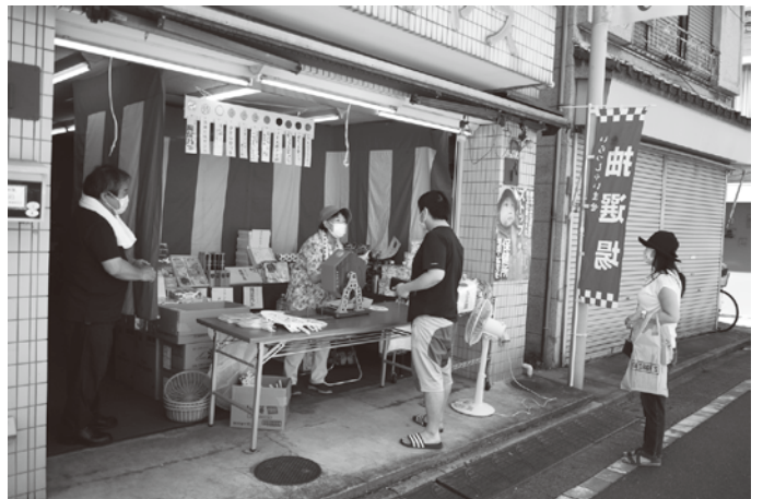
2021年7月、中元福引きイベント(小台本銀座商店会)