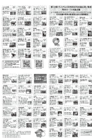
特別セール案内チラシ

プレミアム付きお買い物券に 連動する特別セールも実施 特別セールを実施するお店は無料で特典案内チラシに掲載される。今回チラシに掲載されたのは60店。主な特典は各商店街のポイントアップや特定商品の割引販売、粗品プレゼントなど。 お店で出来る特典を検討していただき、次回も数多くのお店のチャレンジを期待したい。