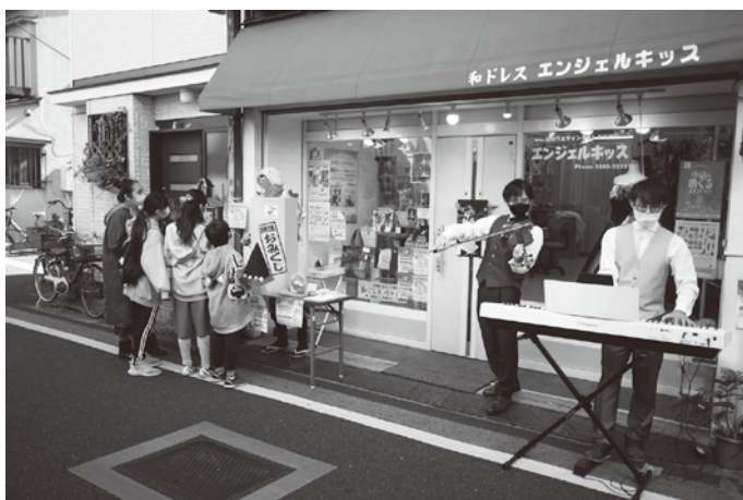
2021年10月、ハロウィンイベント(荒川なかまち通り商店会)