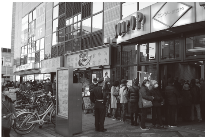
センターまちや商店会(サンポップ)の発売前の行列