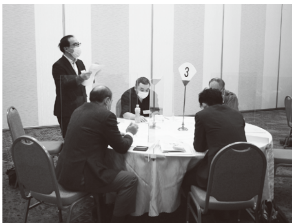
まとまった提案を各テーブル毎に発表

内容をテーマに、ラッキーナンバーくじの配布や抽選と我楽多市の実施方法の見直し等が議題となった。 テーブル毎のグループに分かれディスカッションをおこない検討結果を発表、開催内容にその成果を活かしていく事となった。