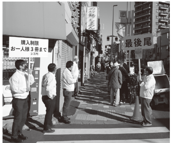
まちやアベニューの行列最後尾

毎年の区商連商業祭は拡販の大きなチャンス、今後も商店街加盟店の積極的な取り組みをお願いしたい。