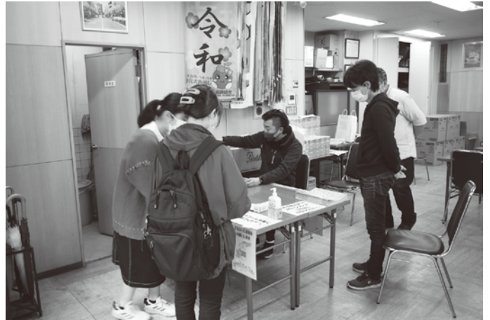
2021年4月、商業祭イベント(小台大通り商店街振組)