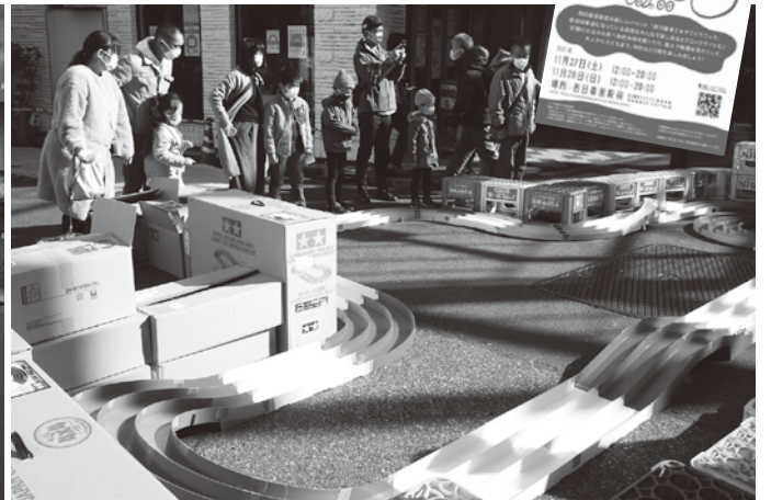
ミニ四駆のサーキット