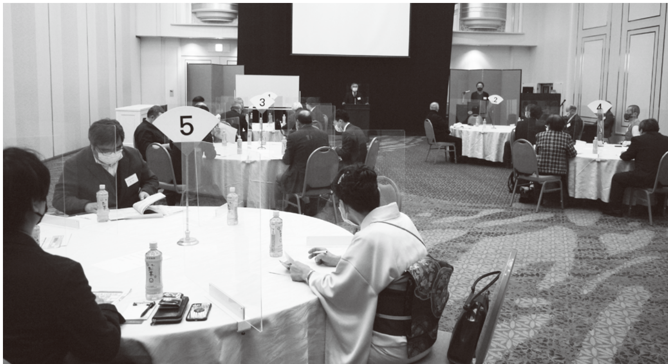
浅草ビューホテルの会場では感染対策に万全の注意を行い開催