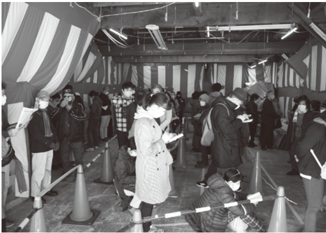
まちやアベニュー組合事務所内にも行列