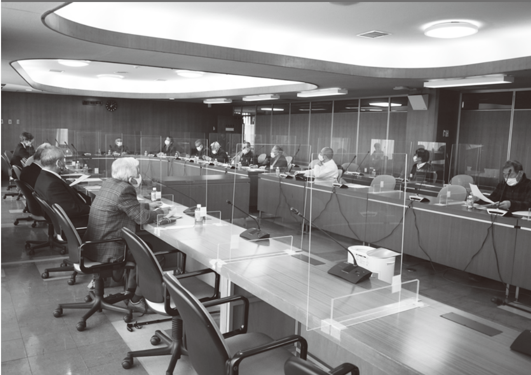
区商連定例理事会は新型コロナウイルス感染防止のためアクリルシールドされた会場で開催