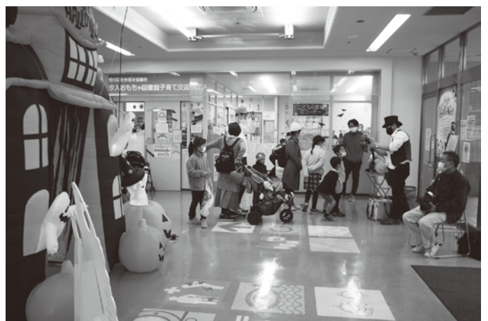
2021年10月、ハロウィンイベント(べるぼうと汐入商店街振組)