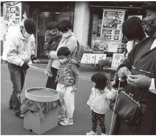
ベーゴマやけん玉コーナー

イベントの主催は西日暮里駅前イベント実行委員会。開催には荒川区や地元の西日暮里駅前商店会、地域の企業や市民団体、地元町会が協力した。今回は第1回だが、地域の祭りになるよう次回も計画。