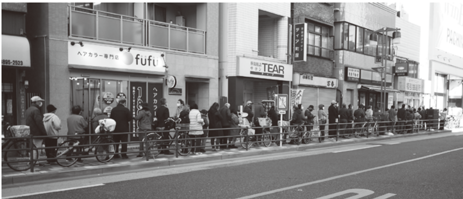
発売時間30分前からまちやアベニューでは長い行列ができた

購入限度は前回同様の一人3冊まで(1冊1万円で額面1万2千円分)。今回も商店街での発売分のほか、ハガキまたはWebでの申込みによる抽選販売も実施した。