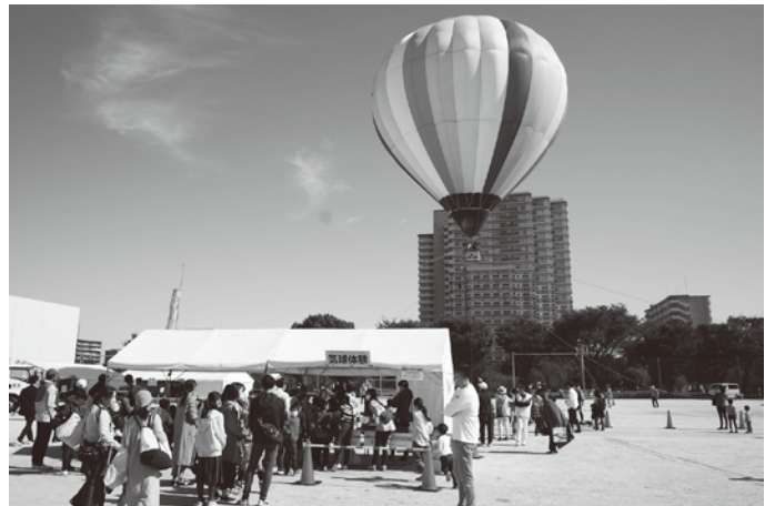
2021年10月、広域支援型商店街イベント(旭電化通り商光会商店街振組)