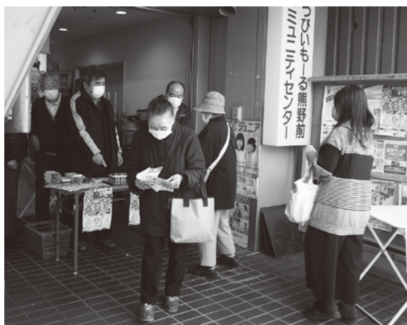
熊野前商店街の売場の様子