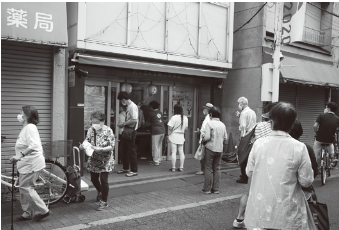
ふれあいCITYおぐぎんざの発売受付