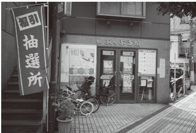
小台大通り商店街(あっぷるロード)の抽選会場