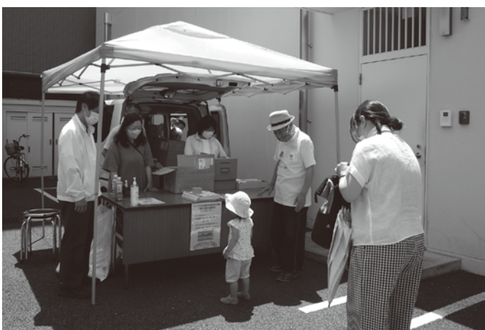
午後の特別券の引換販売に訪れた親子

予約券は配布終了、行列は並ぶ間隔を空けたこともあり、売場入口から路地を抜け、周辺をぐるりと一周する長さになった。 お買い物券は発売時間前に並んだ人の分で予定数を完売、開始から約30分で終了する大人気となった。 販売場所では、引き続き午後1時