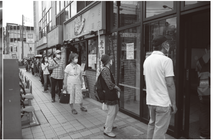
ちょっと、まちやでは行列が建物を一周