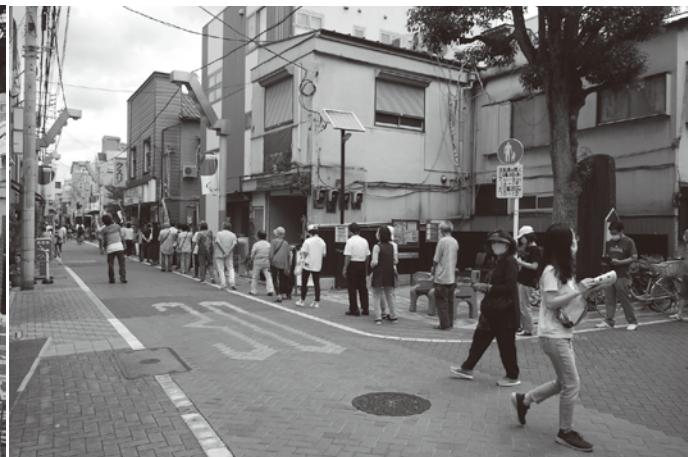
それでもはっぴいもーる熊野前は長い行列