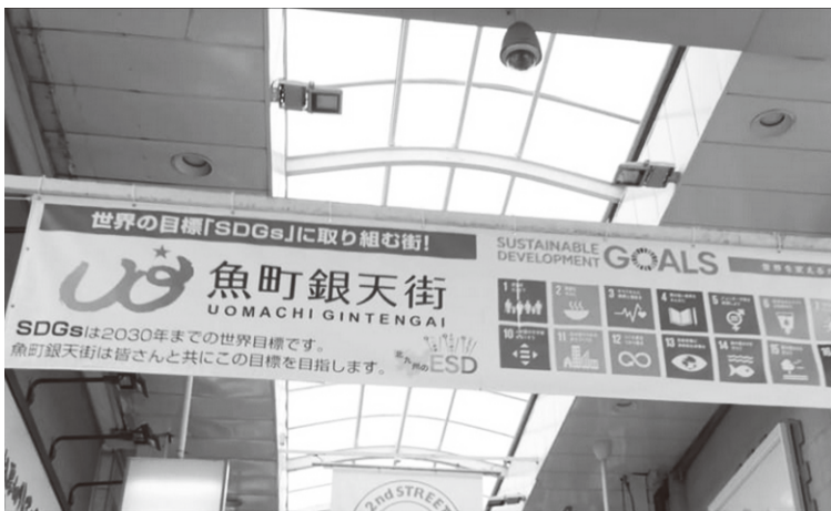
小倉の銀天商店街アーケードのSDGsの活動フラッグ

商店街の活性化も、広く街づくりの視点で発想し、地域人材を巻き込んだ活動へ発展させることで持続可能な商店街が実現できる。