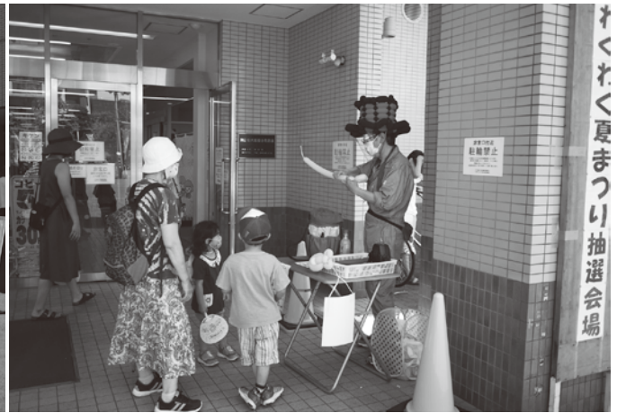
べるぼうと汐入商店街のバルーンアート