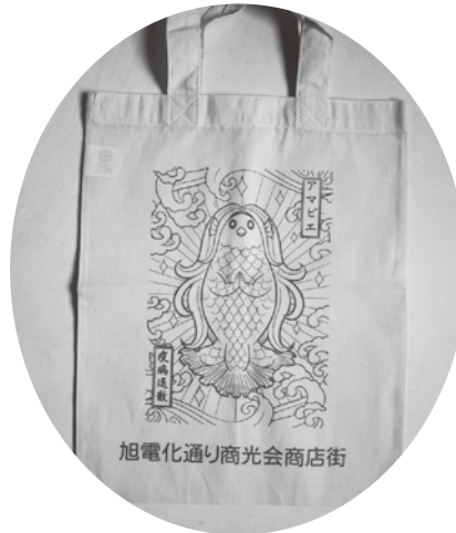
旭電化通り商光会商店街 サマーフェスタの1等賞品 アマビエ・疫病退散の オリジナルトートバック