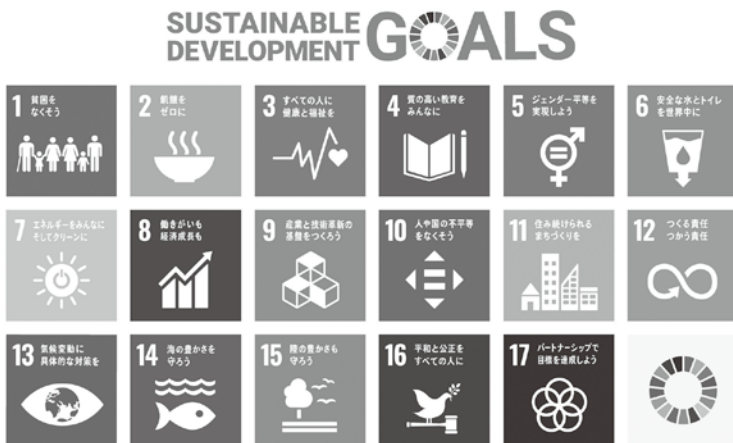
SDGsで取り組む17の活動目標シンボルサイン

荒川区の商店街でも、すでにエコに取り組んでいるが、このエコ活動も持続可能な開発目標としてのSDGs活動を意識した積極的な動きが国内の商店街で始まっている。