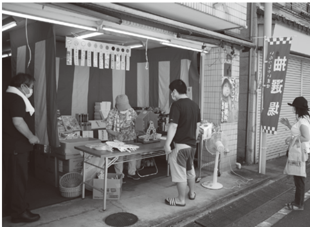
小台本銀座商店会の抽選会場

夏のイベントは今年も三密を避け 安心安全のため抽選会で開催! 例年、夏のイベントは各商店街が工夫した方式で開催していたが、昨年以上に厳しい新型コロナウイルス感染状況のなか、行列や密を作らない抽選セールでの実施が主流となった。 各抽選会は、お買い物時の福引き補助券の配布や商店街スタンプ券での抽選会にしたりと、各商店街で様々な方法がとられた。 当選景品は生活実用品やお買い物商品券が中心だったが、熊野前商店街は現金が当たるということで、抽選日に取材、その場で当選賞金合わせて5千円近くの現金を受け取ってあげず顔のお客様もいた。