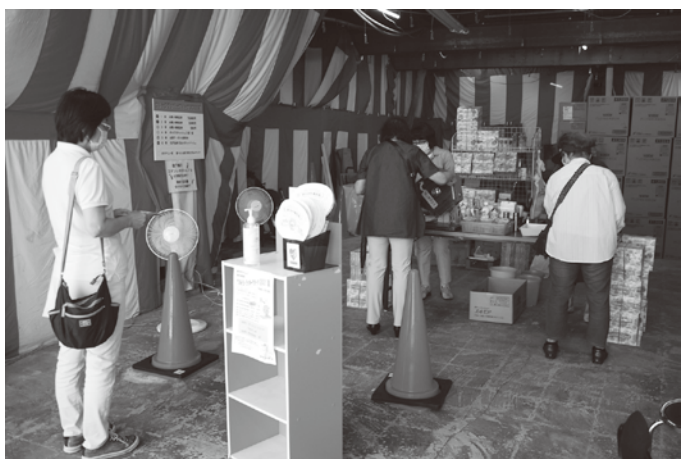
荒川銀座商和会(まちやアベニュー)の抽選会場