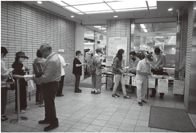
ちょっと、まちやの発売受付