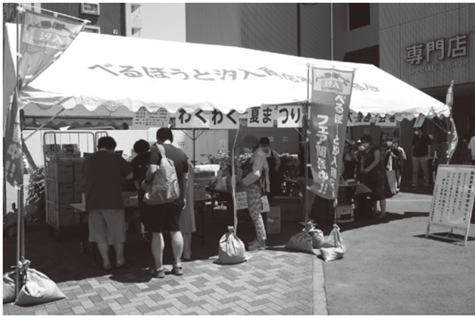
べるぼうと汐入商店街の抽選会場