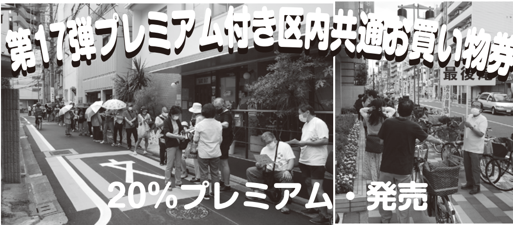
まちやアベニューの発売時間前の状況

荒川区商店街連合会では、令和3年6月12日（土曜）午前10時から、20パーセントのプレミアムが付いた区内共通お買い物券を発売した。