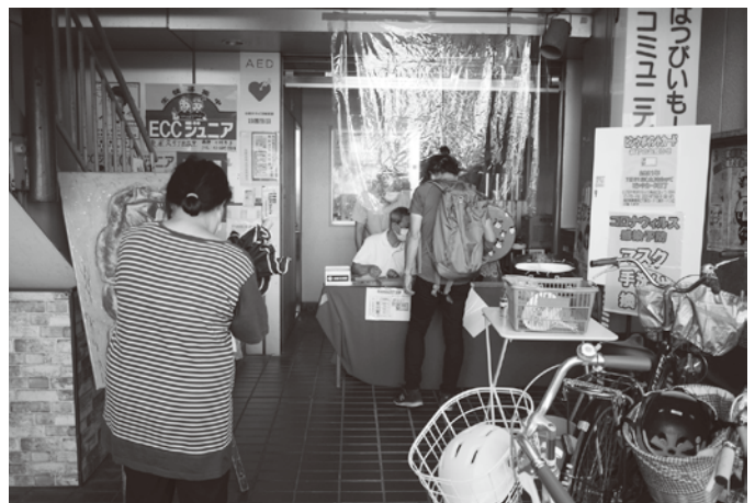
熊野前商店街(はっぴいもー熊野前)の抽選会場