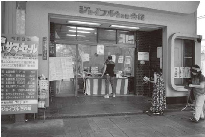
三の輪銀座商店街(ジョイフル三の輪)の抽選会場