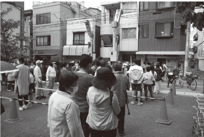
はっぴいもーる熊野前は事務所前の尾久小の校庭も活用