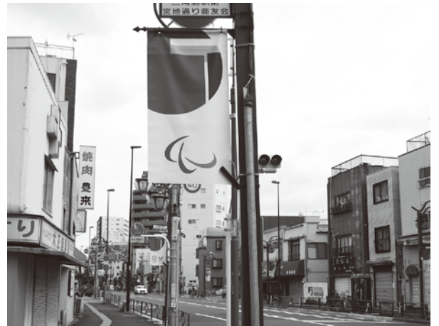
新しくなったオリパラのフラッグ(6月11日に三河島駅近くで撮影)