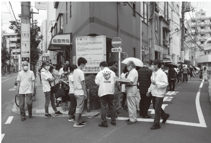
時間前の購入希望者に組合スタッフが整理券を配布

町屋地区の荒川銀座商和会商店街振興組合（愛称まちやアベニュー）の販売場所を取材。前回同様、三密対策で城北信用金庫町屋支店横の駐車場を借り実施した。 緊急経済対策としての実施でプレミアム率が20%とお得なこともあり、発売時間前に予定数に合わせた