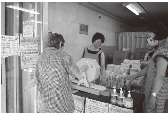
荒川なかまち通り商店会の抽選会場

夏のイベントは今年も三密を避け 安心安全のため抽選会で開催! 例年、夏のイベントは各商店街が工夫した方式で開催していたが、昨年以上に厳しい新型コロナウイルス感染状況のなか、行列や密を作らない抽選セールでの実施が主流となった。 各抽選会は、お買い物時の福引き補助券の配布や商店街スタンプ券での抽選会にしたりと、各商店街で様々な方法がとられた。 当選景品は生活実用品やお買い物商品券が中心だったが、熊野前商店街は現金が当たるということで、抽選日に取材、その場で当選賞金合わせて5千円近くの現金を受け取ってあげず顔のお客様もいた。