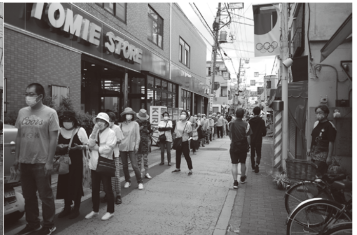
ふれあいCITYおぐぎんざの長い行列