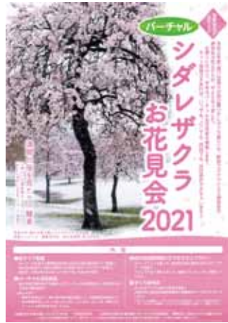
バーチャルイベントの告知チラシ

荒川区内の桜の名所を巡るスタンプラリーやさくらをテーマに詠んだ俳句を募集するさくら投句会のイベントも行なった。