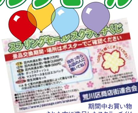
期間中お買い物された方に進呈したスクラッチくじ

同時開催している川の手スプリングセールは参加各商店街毎に実施期間を定め、お買い物された方に「区内共通お買い物券」やA賞B賞C賞など商店街用意の賞品が当たるスクラッチくじを実施した。