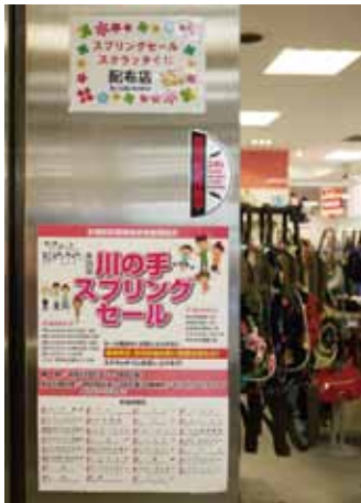
ちよっとまぢやの スプリングセール掲示物