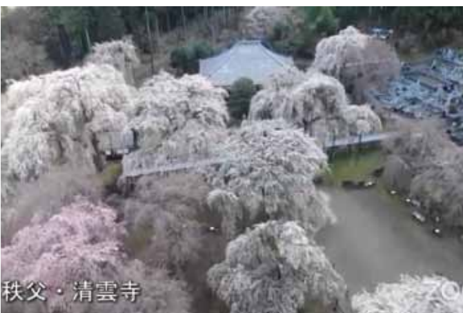
秩父市青雲寺のシダレザクラ(ライブ映像より)