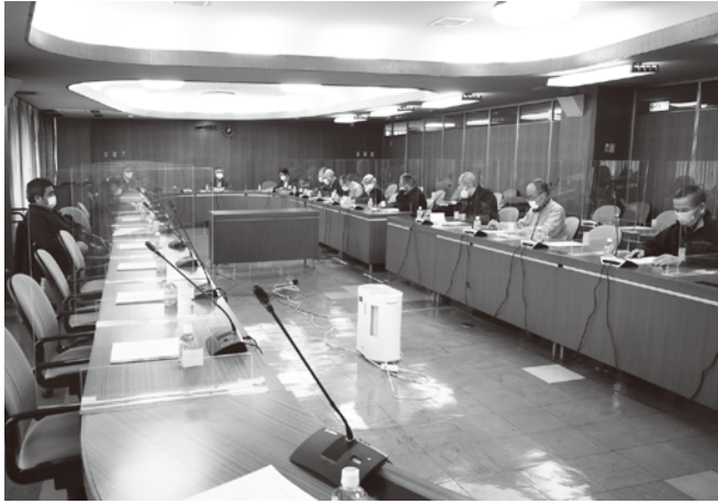
パーティションで区切られた区議会会議室での定例理事会

この状況が好転次第、これまで以上に商店街イベントを再開するとともに、会員間の懇親活動も積極的に進めて行きたい。