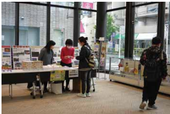
ふらっとにっぽり1階会場