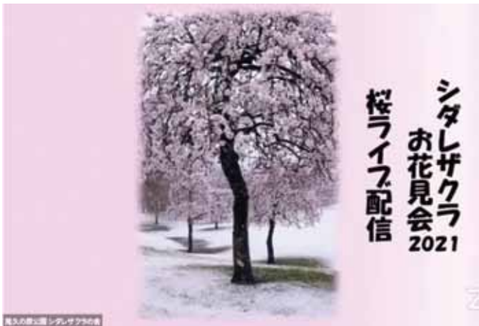
バーチャルライブイベントのスタート画面

併せて配信中、クイズのキーワードに答え、ハガキやファックスの応募をすると秩父の名産等の豪華景品が当たるイベントも実施。 他にもスマートフォンを使って、