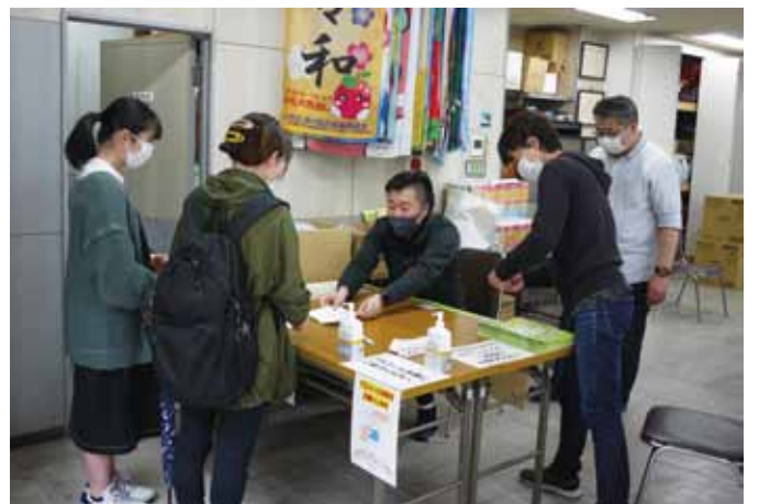
小台大通り商店街アップル館1階会場