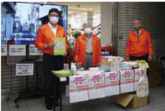
サンポップマチヤ1階会場