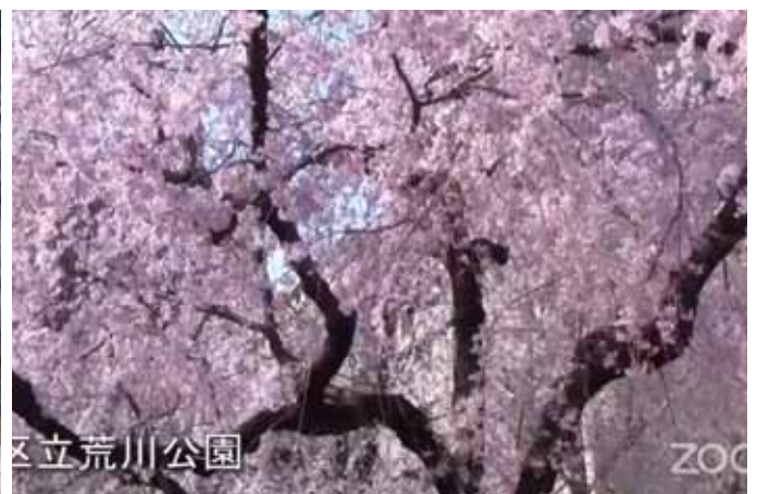
荒川区役所のある区立荒川公園の桜(ライブ映像より)