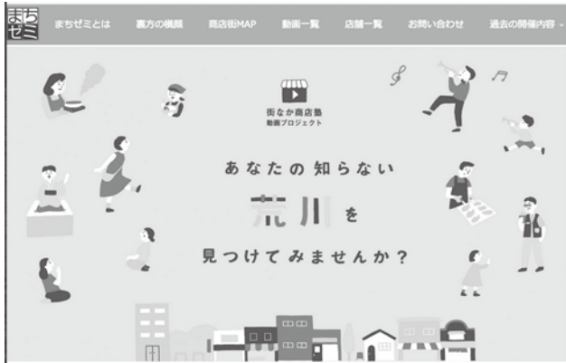
「まちゼミin荒川」のホームページ画面

まちゼミは、店主やお店のスタッフが自分のお店を会場に、プロの専門知識で受講者参加型のミニ講座を開催、活動を通してお店の存在や特色を知っていただくと共に、お店とお客様の信頼関係を築くことを目的に各地で行われている。 令和2年度は新型コロナウイルスの影響もあり、現場での講座実施を中止し、ウェブ動画で商店街を配信した。 このまちゼミの活動に参加希望や興味のある方は「まちゼミin荒川」のホームページをご覧ください。