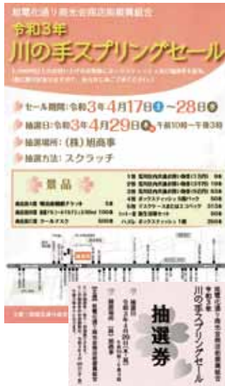
旭電化通り商光会振組の イベントチラシと抽選券

旭電化通り商光会振組はセール期間中に商店街独自の抽選券を配布、4月29日開催の区商連商業祭の日にスクラッチくじとの引換を実施。スプリングセールの景品交換とスクラッチくじを一括で行いPR効果の効率化を図った。