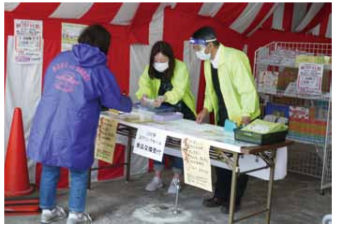
まちやアベニュー商店街事務所会場