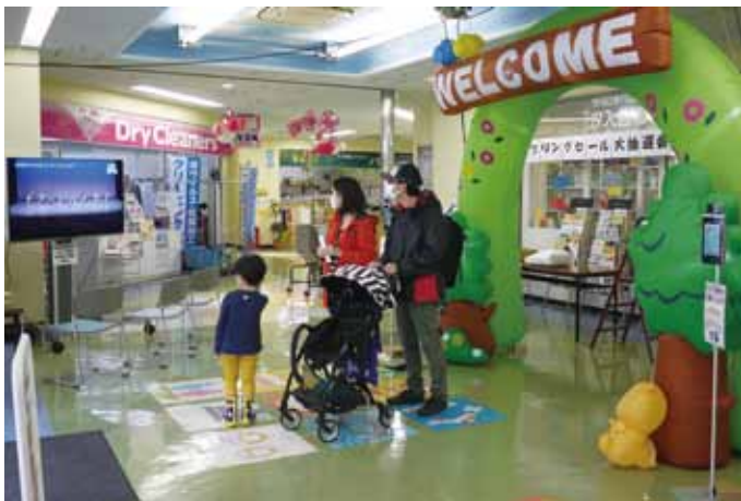
べるぼうと汐入東館会場

当日は朝から小雨の降る天候での開催となったが、区内7ヶ所の大型モニターが設けられた会場を取材。折からの新型コロナウイルス感染者の増加で、三回目の緊急事態宣言が出され、各会場では来場者に商店街スタッフがフェースガードやマスクなど安心安全対策に配慮しながら対応、商業祭のPR活動やスプリングセールの当選したスクラッチくじの景品交換などを実施した。 会場設営の大型モニターで川の手荒川まつりステージショーや商店街PR動画等を放映したが、各会場の入出は密にならず、感染対策の中、安全な運営をすることが出来た。