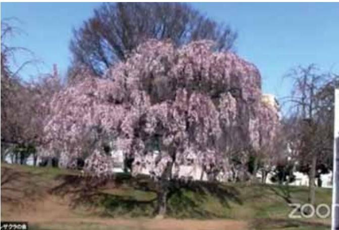
尾久の原公園のシダレザクラ(ライブ映像より)