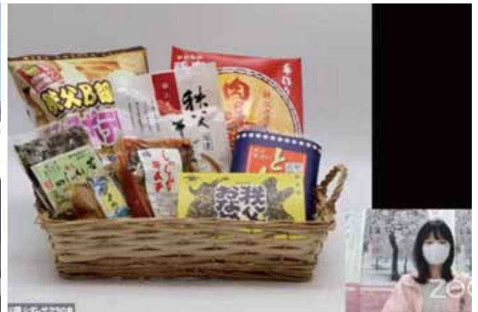
秩父市の産品紹介と解説画面(ライブ映像より)