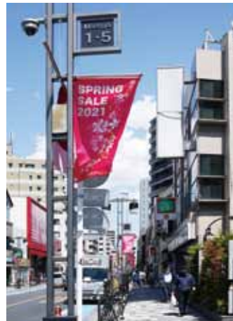
まちやアベニューの スプリングセールペナント

新型コロナウイルス感染対策のため、荒川区商業祭でのスプリングセール抽選会イベントを中止。スプリングセール参加の各商店街では左下表の期間、商店街でのお買物の際にその場で当たるスクラッチくじを進呈、後日開催の荒川区商業祭時に当選くじと賞品の引き換えを実施した。