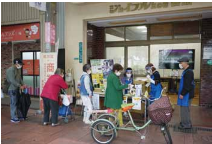
ジョイフル三の輪商店街会館会場

当日は朝から小雨の降る天候での開催となったが、区内7ヶ所の大型モニターが設けられた会場を取材。折からの新型コロナウイルス感染者の増加で、三回目の緊急事態宣言が出され、各会場では来場者に商店街スタッフがフェースガードやマスクなど安心安全対策に配慮しながら対応、商業祭のPR活動やスプリングセールの当選したスクラッチくじの景品交換などを実施した。 会場設営の大型モニターで川の手荒川まつりステージショーや商店街PR動画等を放映したが、各会場の入出は密にならず、感染対策の中、安全な運営をすることが出来た。