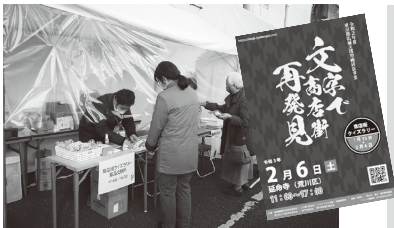
南千住・延命寺のクロージングイベントでのスタンプラリー抽選会