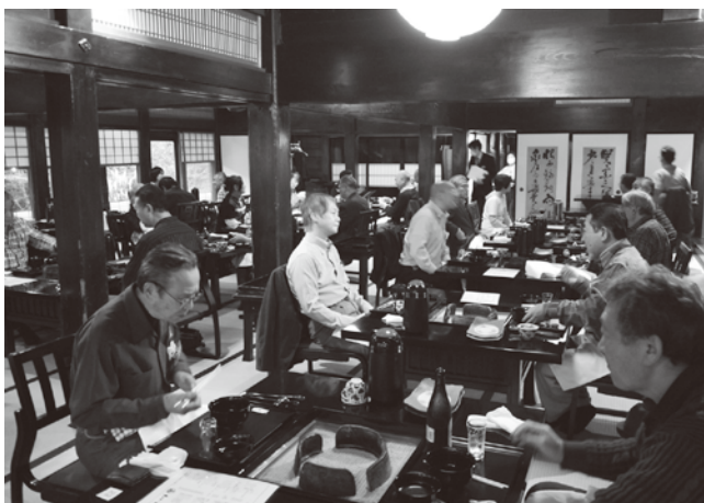
うかい鳥山の合掌造りの会場は密を避けた席で懇親会