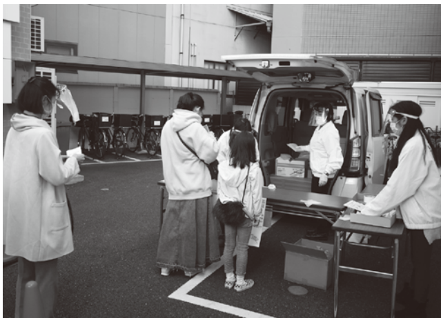
発売当日のまちやアベニューの売場

コロナ感染防止対策を行い各所の売場は販売を実施 まちやアベニューでは新型コロナウイルス感染症予防対策のため、組合事務所を借りに使わず城北信金の駐車場を借りて販売。今回も販売前の7時半から列が出来るほど人気だった。 商店街では行列が密にならないよう注意を呼びかけるとともに交換整理券を発行、ここでの販売額1千百万円分は40分程で終了、販売時の混乱を最小限に抑えた。 ちよつと、まちや(町屋駅前銀座)と尾竹橋通り三栄会商店街の両売場とも7時から購入希望者が集まり、行列が過密にならないよう役員が出るだけの配慮をして販売した。