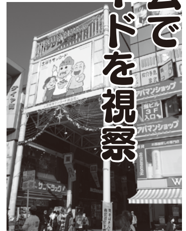
吉祥寺サンロードのアーケード入口

サンロードのある吉祥寺地域は、戦前から作家が多く住み活動していた歴史と、中央線沿線の高円寺や国分寺を合わせた「3寺文化」と言われるカルチャーの中心的発信地として、小説や歌の場所になり、男女を問わず若い世代が住んでみたい人気の駅圏になっている。