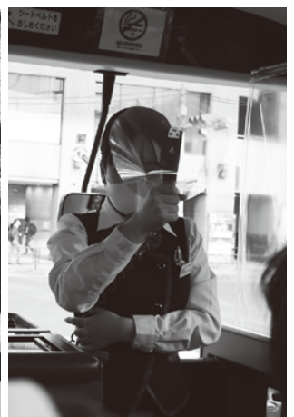
バスガイドさんも飛沫予防対策