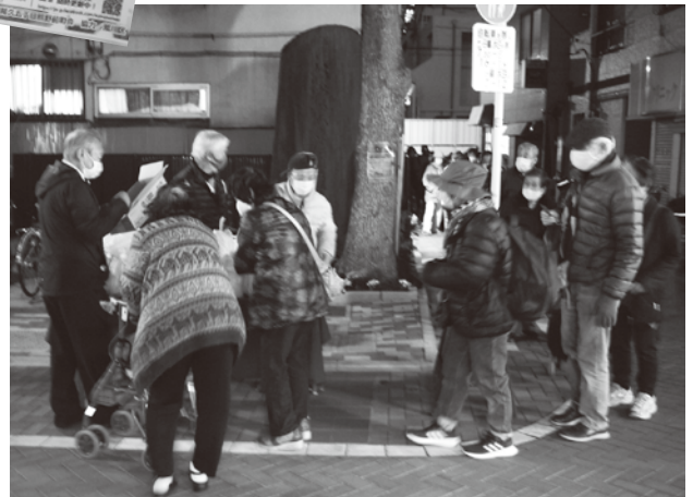
ポイント満点カードと交換に行列