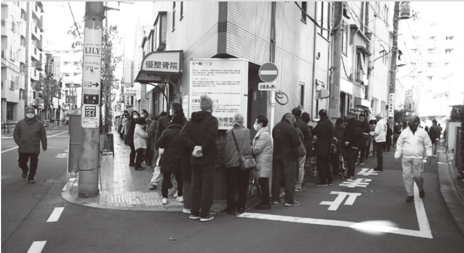
発売時間前からまちやアベニューに長蛇の行列ができたため密集対策をする組合役員