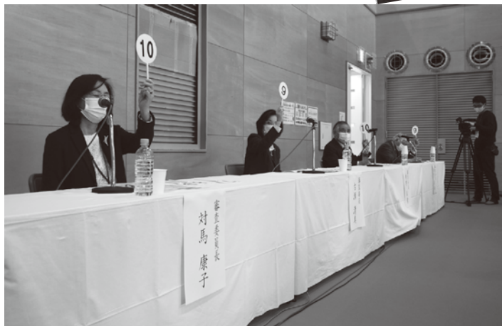
俳句の発表毎に採点する審査委員の各氏

俳句の発表会の進行と司会は太田プロダクションのお笑いタレント「インスタントジョンソン」が担当、俳句を発表をする入選者の話を