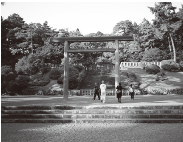
八王子の武蔵野御陵

今回の商店研修会はバス乗車時の検温と消毒に始まり、視察場所や懇親会場でも感染防止に終始万全を心掛けながら実施した。