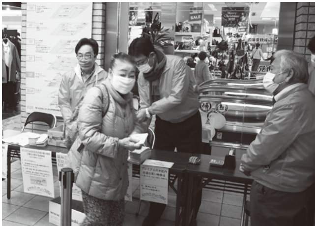
ちょっと、まちや(サンポップ)は発売開始20分で完売