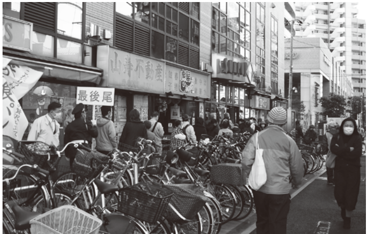
ちょっと、まちや(サンポップ)の行列は外まで続いた