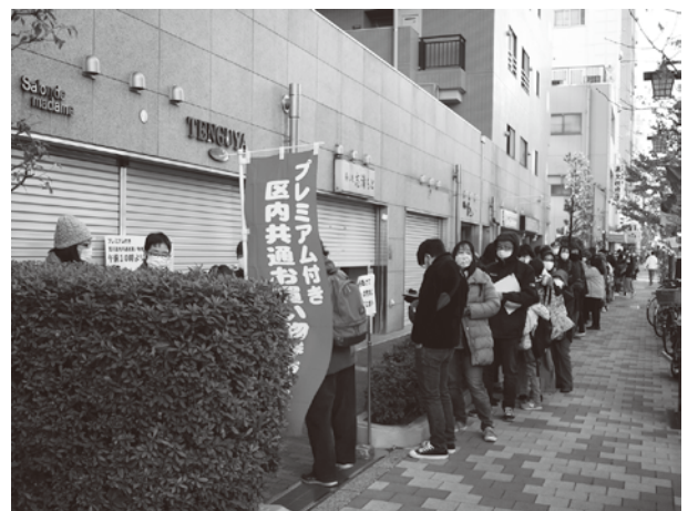
発売時間前から尾竹橋通り三栄会商店街にも行列

コロナ禍でもお買い物券 20%プレミアムは大好評 区内共通お買い物券の発売は今回で16回目、年末の区商連恒例イベントとして待ちわびている区民も多くなっている。 プレミアム率は例年10%での発売だが、今回はコロナの経済対策で倍の20%ということもあり、人気が沸騰、どの売場も即売となった。 お買い物券に大型店用と地元商店街向けの区分けで発行した地域ではプレミアム率が20%以上でも話題にならない例もあるが、荒川区は発行が全店共通で分かりやすく、区内加盟店であればどこでも使える利便性も人気の理由になっている。