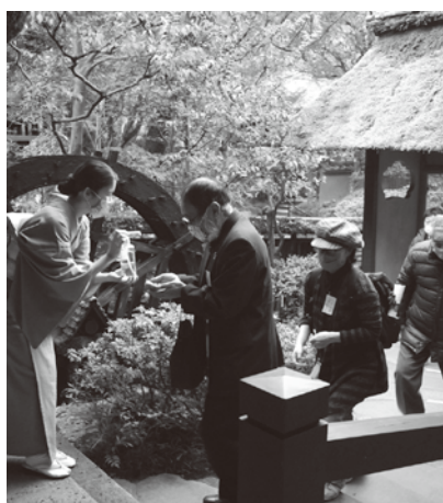
会場入店時にも入念な消毒