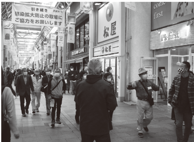
吉祥寺サンロードのアーケード内を視察

サンロードは中央線吉祥寺駅北口から約300メートルの長さで続くアーケードで、入口看板やペナントには、人気作家の西原理恵子の描いたマンガが描かれていた。これらデザインは吉祥寺にゆかりのある人気作家のなかから選び、商店街のイ