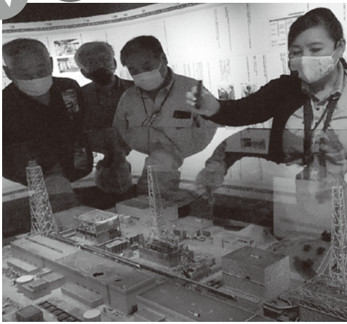
福島第一原発の廃炉工事の説明を聞く

翌日は原発事故や宇宙からの放射線などの展示をする三春町コミュニティ福島を主に見学。帰路の途中、いわき市の夜明け市場（復興商店街）見学、震災復興の現状やGoToキャンペーン施策の一端を学んだ。