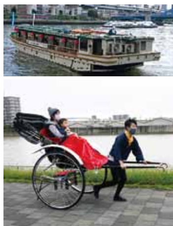
会場から浅草まで屋形船の運行と人力車の試乗体験