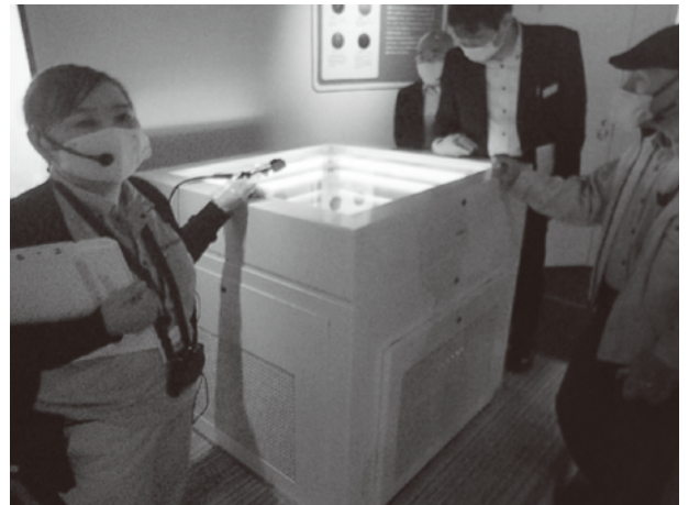
コミュニティ福島のラボで宇宙からの放射線を見る

東京労働局労働基準部賃金課 (TEL.03-3512-1614 (直通)) 東京都最低賃金総合相談支援センター (TEL.0120-311-615)