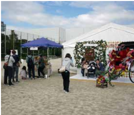
花で飾られたメッセージパネルを背景に記念撮影