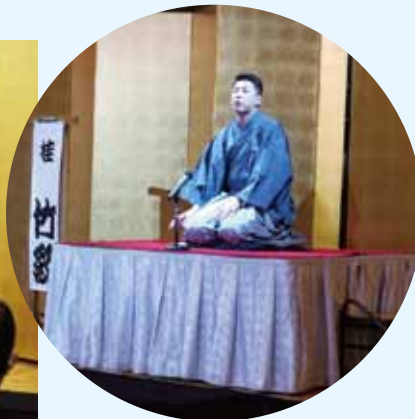
交流会会場の特設ステージで落語家の桂竹紋さんの熱演