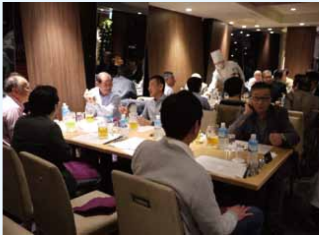
浅草ビューホテル26階で夜景を見ながら懇親会

の消毒や検温も入念に実施、会場の席は密を避け、3人用テーブルに1名で着席するなど、万全を期した。初めに区商連の会長や副会長、事務局スタッフの紹介があり、引き続き、これからの区商連でも活躍が期待される女性も含め25名の各商店街役員の紹介があった。