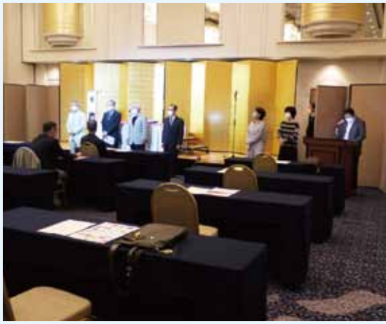
3密対策の会場で区商連役員とスタッフを紹介