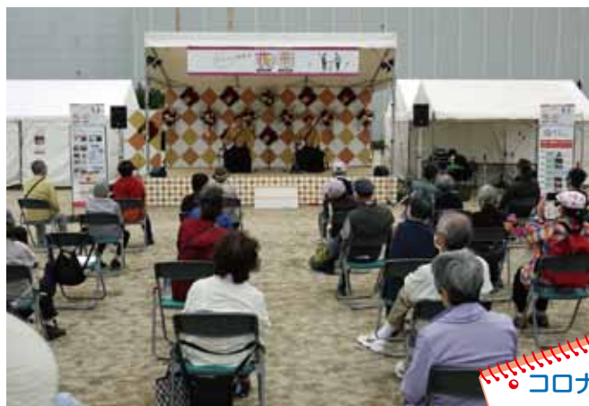
あべや兄弟の津軽三味線の競演