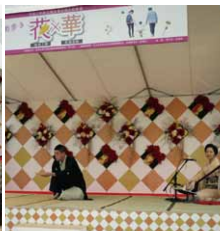
桜川八好による翫間の芸