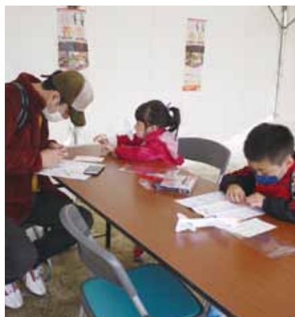
親子で紙飛行機作り