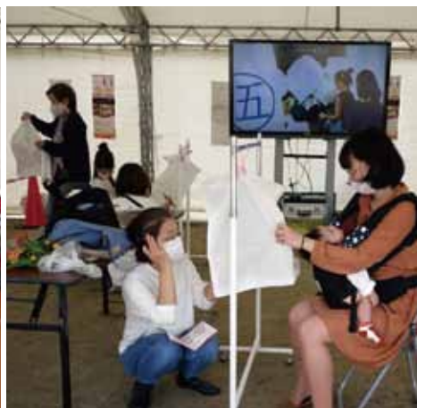
スカイランタンに願いを描く