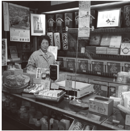
尾竹橋通りに面したお店とキャンペーン抽選箱の置かれた店内