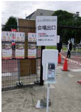
会場入口や各所に消毒スタンドを設置、スタッフも入念な防護対策を実施