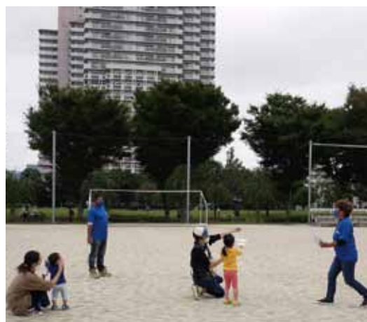
小学3年生以下を対象に紙飛行機大会