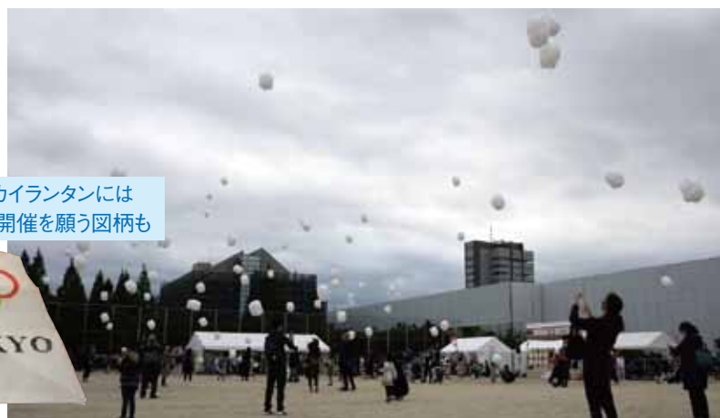
イベントのフィナーレで会場の空にはスカイランタンが舞った