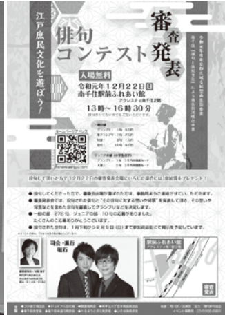
イベント案内チラシ

荒川区は松尾芭蕉や小林一茶を始め、夏目漱石、正岡子規、金子兜太など、多くの俳人ゆかりの地ということから俳句のまち「あらかわ」を主題に俳句関連イベントを毎年何回か開催している。