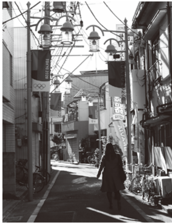
小台本銀座商店会

ラグビーワールド大会のフラッグは1種類のみだったが、今回制作されたフラッグは赤や青など5種類が制作され、彩り鮮やかなフラッグが商店街を装った。 尾竹橋通りでは荒川銀座商盛会から尾竹橋通り三栄会商店街まで4商店街が連続し、フラッグの波でオリリンピック・パラリンピックを盛り上げている。(今回事例の一部を紹介)