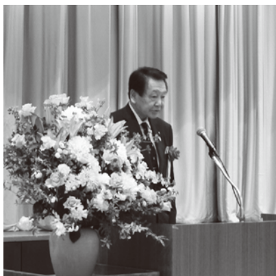
来賓として西川太郎荒川区長が祝辞