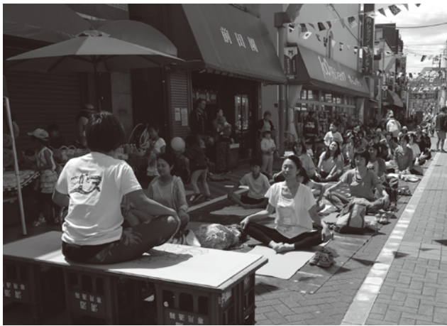
熊野前商店街の通りを埋めるヨガフェス参加者