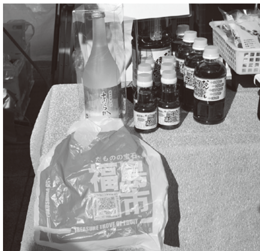
日暮里マルシェで販売された清酒「荒川」

荒川区と福島市は戦時中に荒川区の児童が疎開した縁で友好交流都市になっている。そこで荒川区役所や酒店の有志が田んぼや酒造りの現場に行き、荒川の名前と両地域の交流の歴史を深