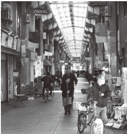
三の輪銀座商店街(振)