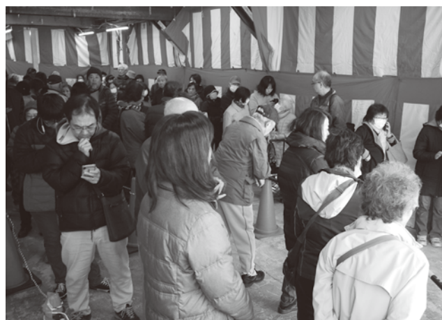
まちやアベニューで路地奥までできた行列

今年もお買い物券への区民の期待や関心は高い。まちやアベニューでは発売額を前回の1千万から2千万円に増やし、売場も商店街事務所1階に変更して販売を開始。発売時間前から昨年同様購入希望者が集まり、長い行列ができた。発売約1時間で行列はなくなりましたが、その後も購入で訪れる人は夕方まで続いた。発売額が多いこともあり、昨年のような当日完売にはならず翌日も販売を行なった。同じ町屋地域で5百万から9百万円に増やし発売するサンポップの売場も取材。ここも時間前から大勢の行列だったが、即完売とはならず、午後とも販売し予定額を完売した。