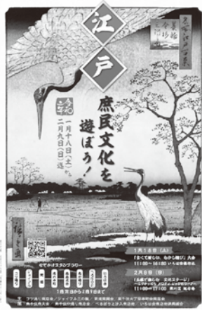
イベントポスター

俳句コンテスト終了後、イベント参加商店街ではなぞなぞスタンプラリー抽選会を開催(抽選券配布期間:1月25日から2月9日)。抽選日は2月8日・9日ジョイフル三の輪会館前で実施。賞品は商店街商品券やお菓子。期間限定のオリジナルメニューを提供する飲食店もあり、盛況のうちにイベントは実施された。