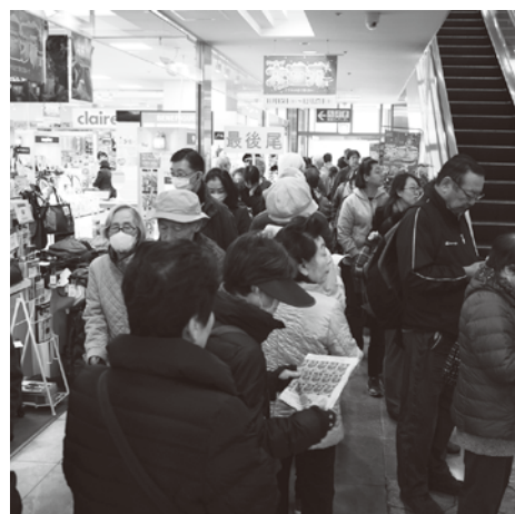
サンポップのエスカレータ付近まで長い行列が続いた

今回は発売額が増えた事もあり「買えなかった」はなかった! 例年の発売額から一気に2倍に増えたこともあり、商店街の各売場では、前回のようには発売開始すぐに完売する売場はなく、ほとんどの売場では翌日の日曜日にも商店街役員が出て販売を継続した。今回取材した限り、取材中に前回のような、「買いたした」という声は聞かれなかったのは良かった。