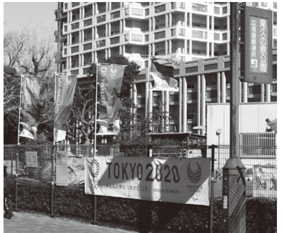
尾久の原公園もフラッグが掲示