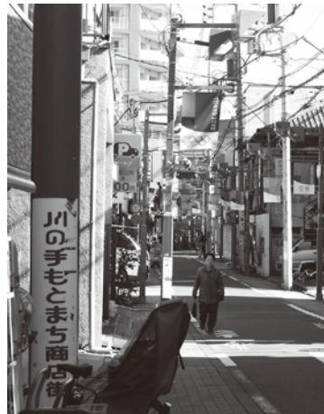
川の手もとまち商店会