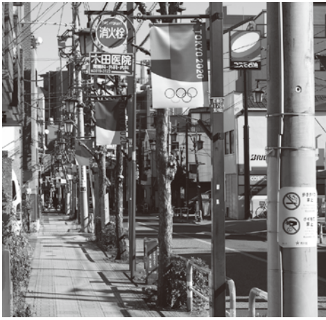
旭電化通り商光会商店街(振)

今回のイベントは、8月の大会終了時までの長期間、区内の主要な商店街でフラッグを掲示し、オリリンピック・パラリンピック東京2020への協力を予定している。