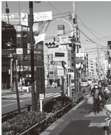
町屋駅前銀座商店街(振)