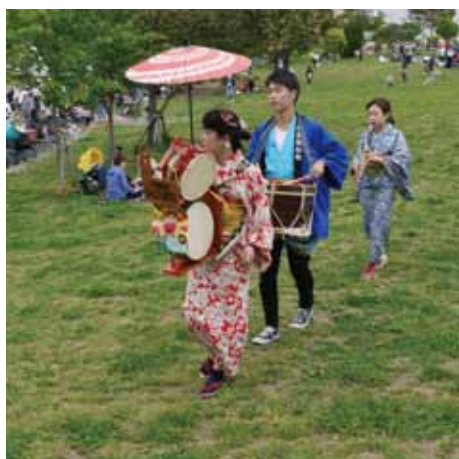
早稲田大学チンドン研究会がPR

当日の参加者集めには、早稲田大学チンドン研究会のメンバーが楽しいチンドンの鳴り物で協力。司会進行はバルーンアーティスト