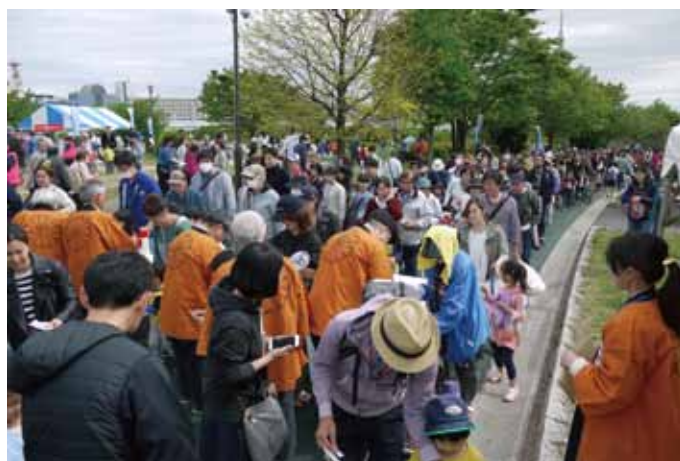
並んだ先着順に700枚の抽選券が進呈された