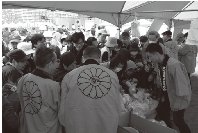
我楽多市の激安商品にみなさん大興奮!!