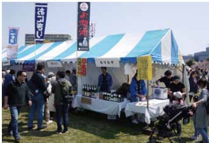
区商連会員店による模擬店

4月6日(土)午前9時半から午後3時まで、都立尾久の原公園を会場にシダレザクラ祭りが開催された。区商連主催の尾久の原スプリングフェスタでは、模擬店の出店とお楽しみ抽選会(区内共通お買い物物券が当たる)を実施した。今年の桜の開花はベストタイミングで満開のなか、陽気も暖かく、例年以上の人出での開催となった。