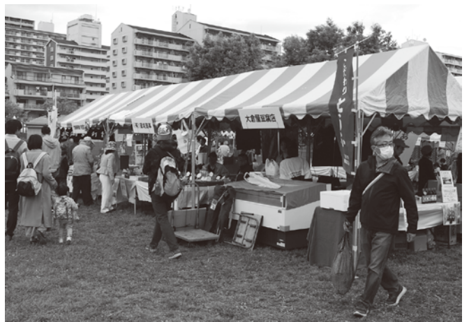
荒川区の名産品コーナーの商店街加盟店