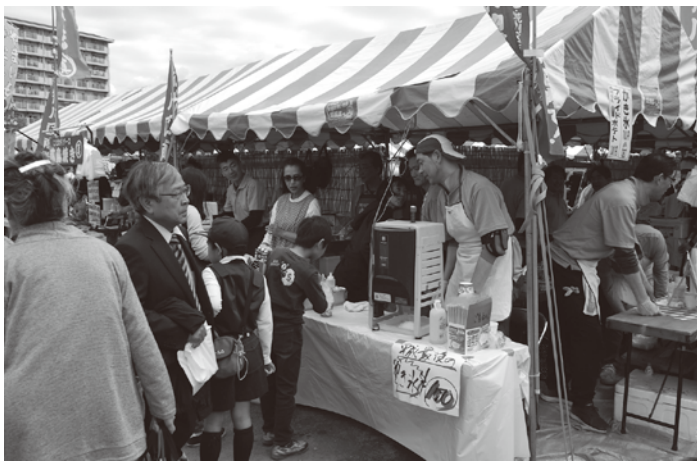
商業祭模擬店の商店街加盟店