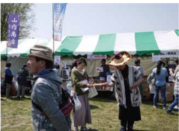
あらかわ逸品の会の模擬店

恒例の抽選会は、配布の行列に並んだ方とさくら投句会の参加者に番号付き抽選券を合計6百枚進呈、イベント終盤に当選番号を発表した。番号発表時に当選者が会場にいない場合は無効のため、多くの観客が、当選番号の発表に注目した。今回の当選は区内共通お買い物物券が1等3万円から4等6千円迄、合計36本と高当選率だった。