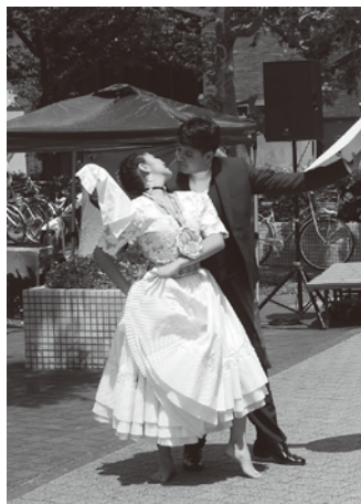
マリネラの踊りも披露

シンコデマヨとは、スペイン語で「5月5日」のことで、この日を祝うメキシコのイベントが、アメリカ各地で始まり、現在では全米各地のお祭りに発展。日本では2013年に代々木公園でスタート。7回目迎える今年も「荒川遊園グラウンド」に会場を移し開催された。