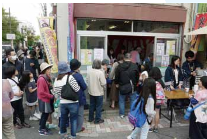
おぐとびあ23で空くじなし抽選会の行列