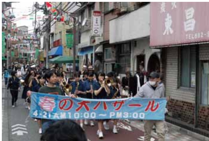
おぐとびあ23で地元中学の吹奏楽部を中心にパレード

4月21日(日)午前10時から午後3時まで、尾久本町通り商店会では第7回おぐとびあ23を開催。 開会は地元区立第九中学校の吹奏楽のパレードからスタート。商店街の通りには数多くのフリーマーケットがオープン。子ども洋品やおもちゃを中心にとくさんの品物が並べられ、賑やかな市が出現した。 商店会はお買い物券が当たる百円抽選会やお菓子がもらえる子どもスタンプラリーを実施、予定時間いっぱい多くの来街者で賑わった。