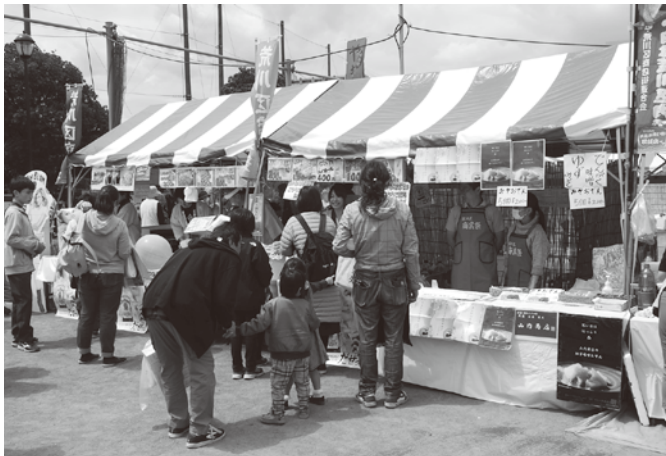
商業祭模擬店の商店街加盟店

■商業祭 荒川区商業祭は、1979年(昭和54年)に、区商連青年部が中心となり区役所前公園で初開催してから、今回で40回目の開催となった。 商業祭会場では商店街連合会会員によるバザール(物販主体)、模擬店の他、区内商店街から提供された商品を激安で売る「我楽多市」や、商業祭当日に無料配布する「ラッキーナンバーくじ」の抽選会を実施。 恒例となった「我楽多市」も、時間前から多くの人が集まり、販売開始と同時に、今回もお得な商品を求める人で争奪戦となった。 また、今回は商業祭第40回記念企画として「大声大会」が実施された。