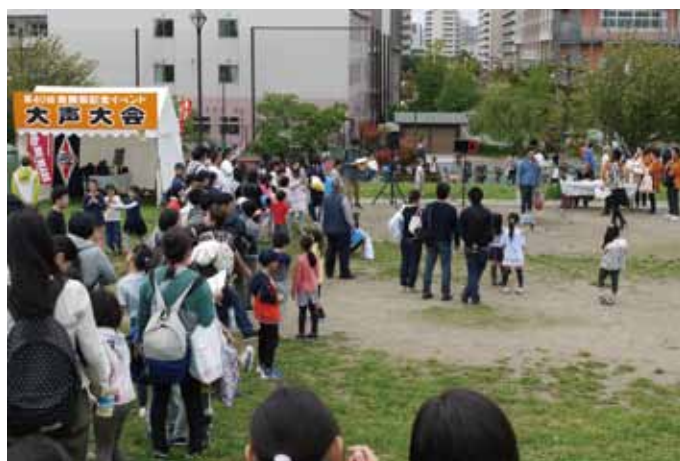
会場に集まった大勢の参加者