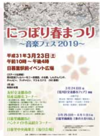
「にっぽり春まつり」のチラシ

3月23日(土)午前10時から日暮里駅前イベント広場で、日暮里中央商業会主催の「にっぽり春まつり」を音楽フェス2019として開催した。 会場では荒川区と交流関係のある市や県が各地の名産品を販売。ステージでは区内の合唱団やミュージシャンが出演、イベントを盛り上げた。