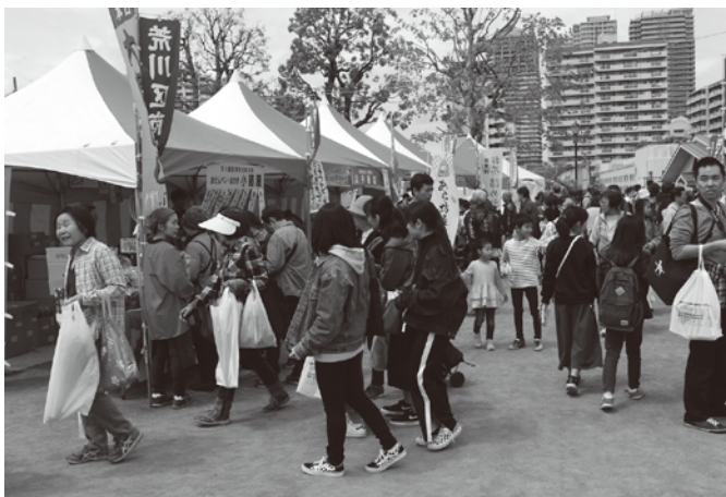
商業祭バザール会場の商店街加盟店

■商業祭 荒川区商業祭は、1979年(昭和54年)に、区商連青年部が中心となり区役所前公園で初開催してから、今回で40回目の開催となった。 商業祭会場では商店街連合会会員によるバザール(物販主体)、模擬店の他、区内商店街から提供された商品を激安で売る「我楽多市」や、商業祭当日に無料配布する「ラッキーナンバーくじ」の抽選会を実施。 恒例となった「我楽多市」も、時間前から多くの人が集まり、販売開始と同時に、今回もお得な商品を求める人で争奪戦となった。 また、今回は商業祭第40回記念企画として「大声大会」が実施された。