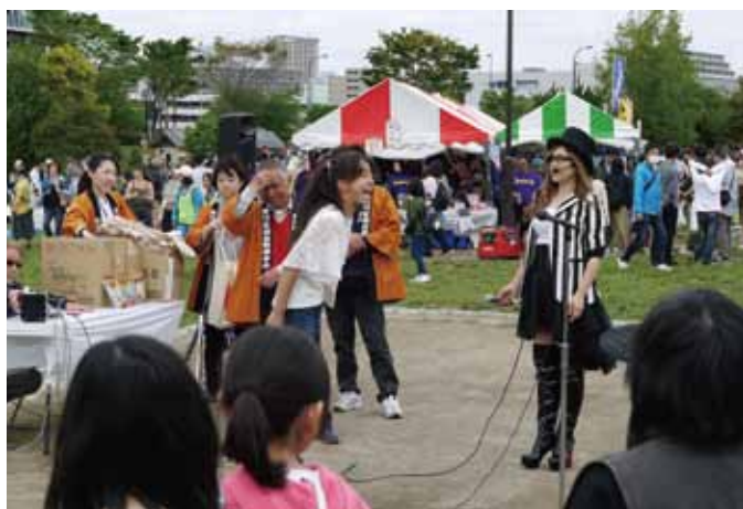
「ママ大好き」と大声で叫ぶ参加者