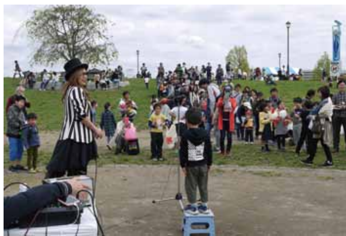
台の上に乗る丘陵に向かい叫ぶ参加者

のさくらさんが担当。個々の参加者へのインタビュや即興のトークで大会を盛り上げた。 大声大会の参加ルールはマイクの前に立って15秒の持ち時間内に、区内でよく利用する商店街名か、区内の好きな場所、または家族への感謝の気持ちを大声で叫ぶこと。 叫んだ声を計測し、基準音量を越えた参加者にお買い物券を進呈、未達成でも参加賞として区商連オリジナルエコバックを全員に進呈した。 また、小学生以下の参加者にはお菓子もプレゼントされ、予定数の70名が商品券をゲット、参加総数は100名を越える盛況となった。