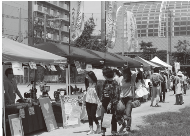
遊園地通り商興会のマルシェ

ラテンフェスティバルのシンコデマヨはシンコデマヨ実行委員会と遊園地通り商興会の共催で5月11日（土）・12日（日）に開催された。 国際色溢れる雰囲気の中で、本格的なメキシコのフードやドリンクの他、ロック、ソウル、ニューオーリンズジャズ、サンバやサルサなど多彩な音楽が会場に溢れ、子どもから大人まで楽しんだ。 会場では10時から18時の開催だが、アフターパーティが19時〜20時まで商店街のお店で開催され、夜までシンコデマヨの熱気は続いた。