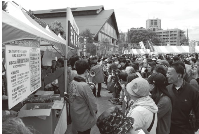
我楽多市に売出し時間前から多くの人が集まった