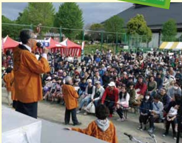
抽選会の当選番号発表に大歓声