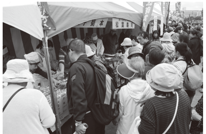
商業祭バザール会場の商店街加盟店

会場は北海道広尾町から和歌山県みなべ町まで全国27の交流都市が参加。区内の官公庁・各種団体も含め、50を越えるコーナーが出店。特設ステージでは、仮面ライダージオウ&ビルドショー、ダンスや太鼓等の演技もあり、今年も延べ4万人近い入場者で、荒川区最大最大のイベントとなっている。