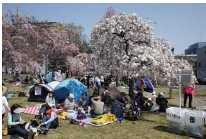
満開となったしだれ桜