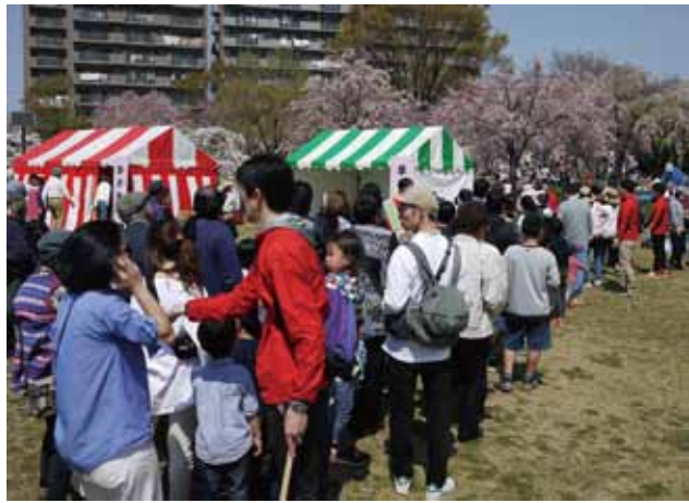
当日の抽選券配布には長い行列が

恒例の抽選会は、配布の行列に並んだ方とさくら投句会の参加者に番号付き抽選券を合計6百枚進呈、イベント終盤に当選番号を発表した。番号発表時に当選者が会場にいない場合は無効のため、多くの観客が、当選番号の発表に注目した。今回の当選は区内共通お買い物物券が1等3万円から4等6千円迄、合計36本と高当選率だった。