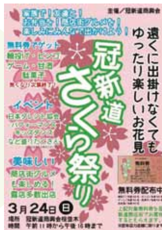
冠新道さくら祭りのチラシ

冠新道商興会では3月24日(日)午前11時から満開の桜並木を会場に、商店街グルメの露店も多数出店し、冠新道さくら祭りを開催した。 会場設営の特設ステージで、日本タレント協会所属のタレントによるパフォーマンスやキッズダンスなど、盛りだくさんの演目が夕方の4時の閉会まで会場を盛り上げた。