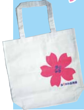
区商連オリジナルエコバック

4月6日(土)午前9時半から午後3時まで、都立尾久の原公園を会場にシダレザクラ祭りが開催された。区商連主催の尾久の原スプリングフェスタでは、模擬店の出店とお楽しみ抽選会(区内共通お買い物物券が当たる)を実施した。今年の桜の開花はベストタイミングで満開のなか、陽気も暖かく、例年以上の人出での開催となった。