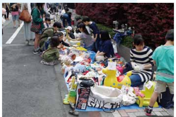
おぐとびあ23に出店のフリーマーケット