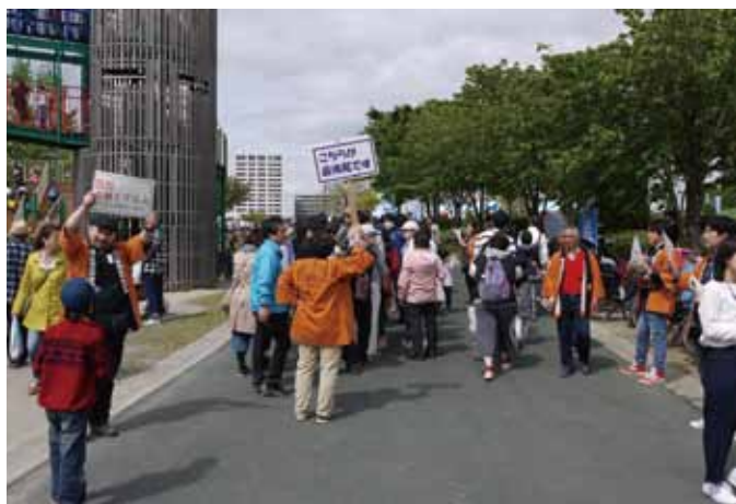
今回も抽選券の配布には大勢の行列ができた