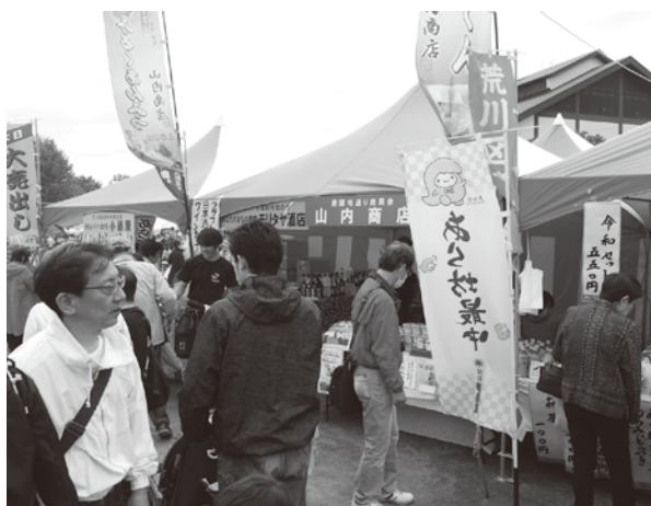
商業祭バザール会場の商店街加盟店

会場は北海道広尾町から和歌山県みなべ町まで全国27の交流都市が参加。区内の官公庁・各種団体も含め、50を越えるコーナーが出店。特設ステージでは、仮面ライダージオウ&ビルドショー、ダンスや太鼓等の演技もあり、今年も延べ4万人近い入場者で、荒川区最大最大のイベントとなっている。