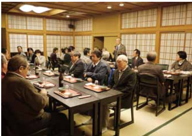
研修打ち上げの懇親会で会長挨拶(浅草・割烹金泉)

的広場が作られ、オリオンスクエア(正式名称宇都宮市オリオン市民広場)と名付けられた。ここを使い市民相互の交流や魅力ある商店街イベントが開催されるようになった。 現在、年2回開催されるジャズフェスティバルを含め、毎月必ず何らかの集客イベントが開催され、オリオン通り商店街の活性化に大きく貢献しているとの事。 今回の視察はこの他、サロンパスで知られる久光製薬宇都宮工場見学や佐野の「道の駅みかも」を訪問。 途中、小雨に降られる研修会となったが、出発の午前9時から、午後8時の解散迄まで、予定のスケジュールを無事に完了した。