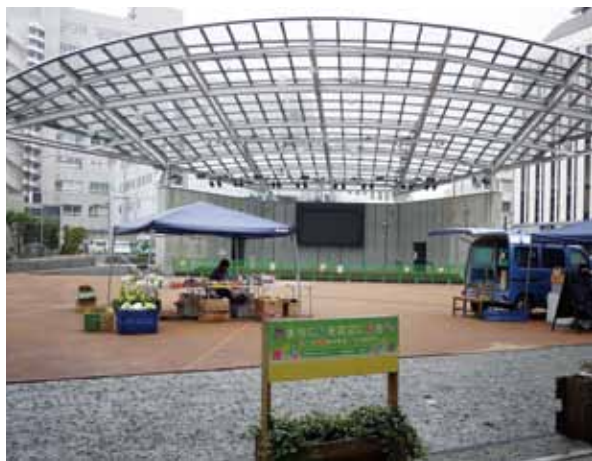
毎月何らかのイベントが開催されるオリオンスクエア

構成業種はカフェ、飲食店を中心に各種の業種がある。アーケードの東端にパルコとドン・キホーテ、西端に東武宇都宮駅と駅ビル内に東武