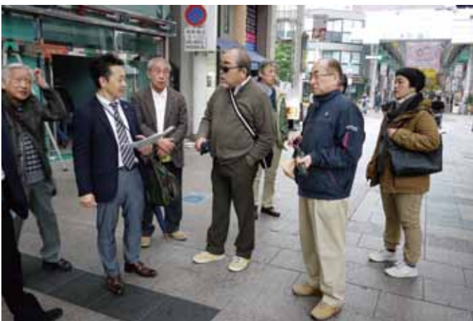
宇都宮商工会議所の方から商店街の近況を聞く

百貨店があり、回遊性のある街区構成がなされている。 しかし、商店街の商環境はバブル期の地元足利銀行の経営危機による市全体の経済的停滞や、近年の再開発でJ.R宇都宮駅前にララスクエア、周辺にパルコなどの大型商業施設の進出があり、中心市街地としての集客力が弱まる傾向にある。 この対策として、商店街で廃業した山崎百貨店跡地に平成16年、多目