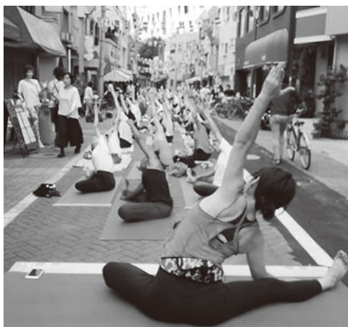
熊野前商店街でストリートヨガ

本イベントは、商店街加盟の若い店主が実行委員会を組織し、計画から開催まで約1ヶ月という短期間で実現にこぎつけました。集客のメインターゲットを「大人女子」と設定し、SNS（フェイスブックやインスタグラム）を中心とした情報発信や商店街有志によるポストインク等を行い、商店街に新たな客層を呼び込むことができました。