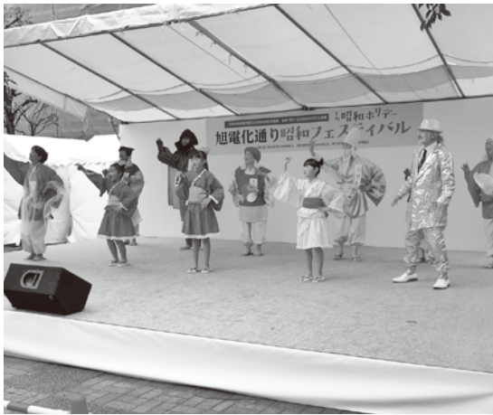
七福音頭としちふく童が七福神をテーマに熱演

会場内では、なつかしい昭和の商店街風景の写真展示や昭和レトロ市を始め、レトロな射的やスマートフォン等のご縁日が出店、昼頃から小雨がぱらつく寒い天候となったが、世代を超えて会場では昭和の雰囲気を楽しんだ。