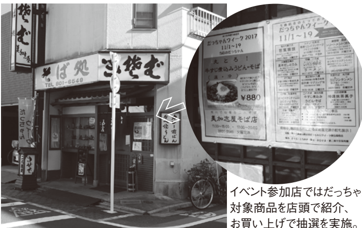
イベント参加店ではだっちゃんの対象商品を店頭で紹介、お買い上げで抽選を実施。

併せてウィーク期間中、商店街各所に近隣5ヶ所の保育所の園児が描いた絵を展示した。