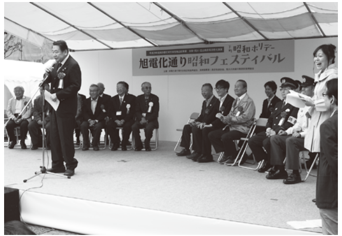
オープニングセレモニーで西川太一郎荒川区長が祝事

開催日は朝から曇空のなか、会場となった荒川区立原公園には、お年寄りから、子育てファミリー世代まで多くの方が来場。