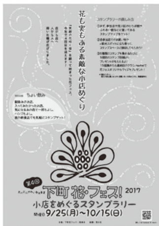
下町花・フェスのリーフレット

荒川区にぎわい創出事業（補助率1/2、補助上限50万円）を活用して開催し、参加店舗が連携して他店の耳寄り情報を提供したり、飲食店では特別価格のメニューを出す等の工夫を行い、多くのお客様を笑顔にするイベントとなりました。