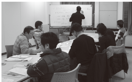
一店逸品運動の研究会風景

これらのポスターは、街なか商店塾を開催しているお店に一枚ずつ掲示していますので、そちらもお楽しみください。