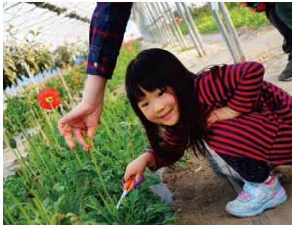
とみうらでのポピーの花摘み

日帰りバス旅行は、区役所前を予 定の午前8時に出発。アクアライン・ 館山道を経て南房総カステラ工房 へ。ここでは工房特産の多品種のカ