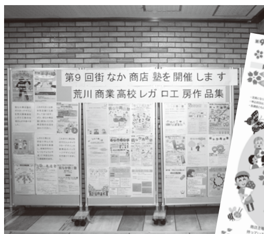
区役所ロビーに展示の「レガロ工房」の作品

区では、にぎわいコーディネーターが商店向けに講座のアドバイスを行うなどサポート体制を強化しています。商店の皆様には、まず「街なか商店塾」への参加をご検討頂き、この事業を通じて集客を図るとともに、お客様の声を受けて、その後のお店の発展に繋げて頂きたいと思っています。