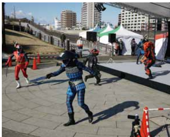
オープニングセレモニーに続き レッドヒーローショーが開催