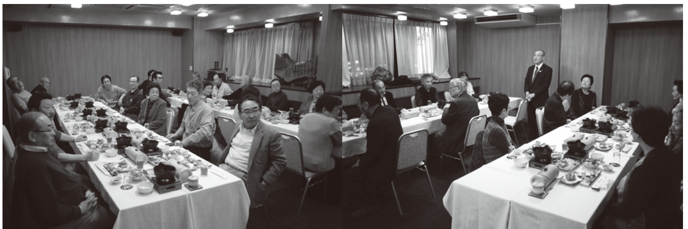
ホテルニュー漁眠荘(台東区)での懇親会