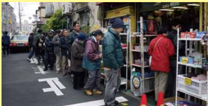
荒川銀座商和会(午前10時10分撮影)