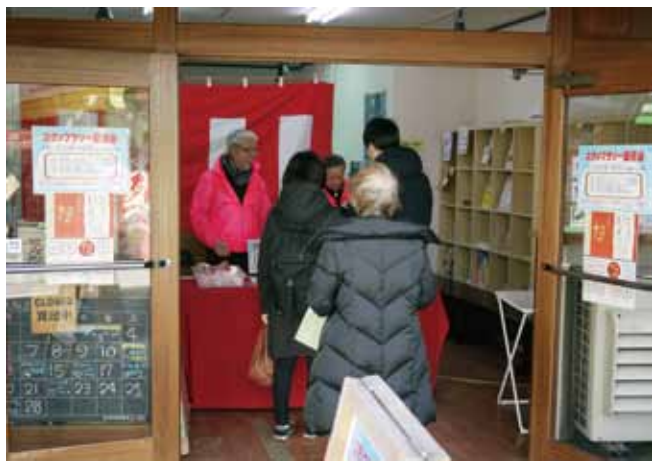
熊野前のスタンプラリー抽選会場(2月12日)