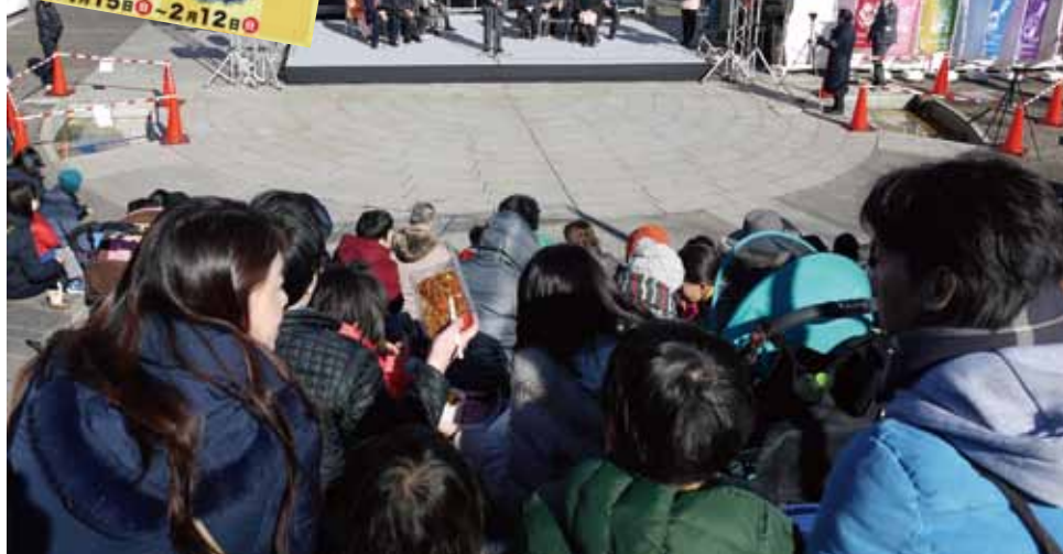
荒川・台東「七福神」商店街めぐりのあらかわ遊園でのオープニングセレモニー