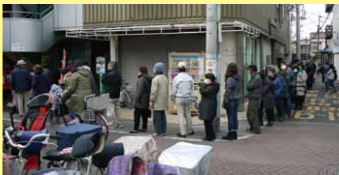
熊野前商店街(午前10時18分撮影)