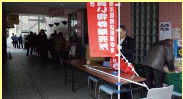
べるぼーと汐入商店街(午前9時43分撮影)

平成28年度のプレミアム付き区内共通お買い物券、1億円分(プレミアム込みで1億1千万円分)が11月27日午前10時から22商店街で一斉に発売。荒川の恒例事業として認知度が浸透、ほとんどの販売所では年々行列が長くなっている。