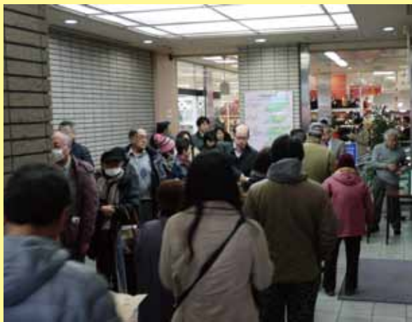
町屋駅前銀座商店街(午前10時6分撮影)