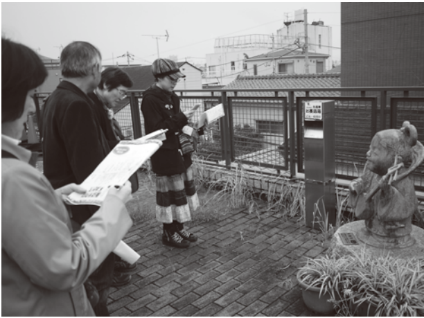
九福神のひとつ、弁財天

視察先の桜本商店街では、当初は先方の事情で視察受け入れができないの話で、自主視察の予定だったが、偶然、視察中にお会いした桜本