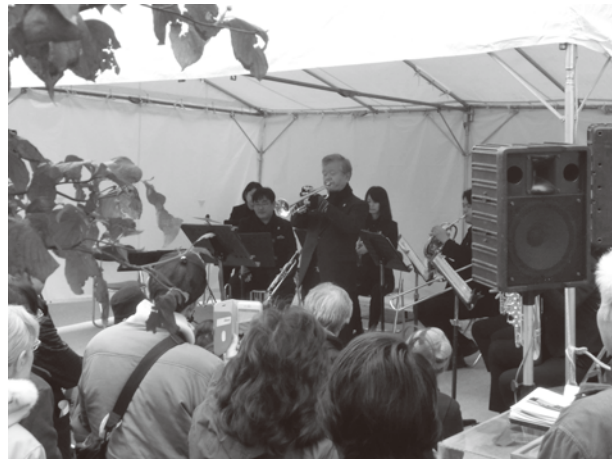
ワールドミュージックフェスティバル風景