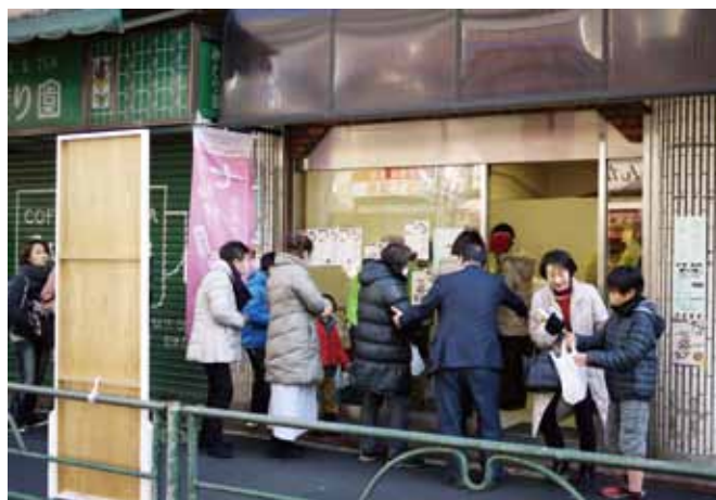
荒川銀座のスタンプラリー抽選会場(2月12日)