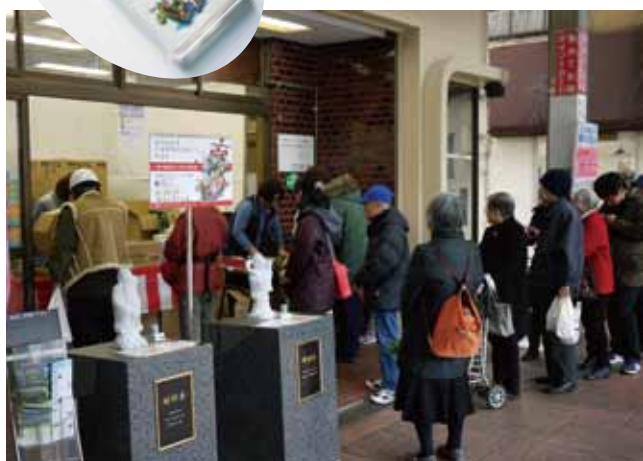
三の輪のスタンプラリー抽選会場(2月11日)

平成29年1月15日から2月12日にかけて実施された東京都広域支援型商店街事業「荒川・台東七福神商店街めぐり」のオープニングセレモニーは、初日の1月15日(日)午前11時からあらかわ遊園のアリスの広場を会場に、事業関係者が列席して開催された。 この日、あらかわ遊園には多くの家族連れが訪れ、オープニングの会場を埋めた。当日はイベントのチラシ持参であらかわ遊園が入場無料になった。開会セレモニーの後、会場では子供に人気のレッドヒーローショーや紙芝居、子供縁日など盛りだくさんの企画が開催され、午後3時のキャラクターショーの終了まで賑わった。