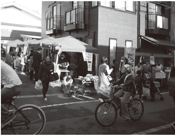
旧大黒湯入口をメイン会場に賑やかに開催された

主会場になった旧大黒湯では、番台も懐かしい脱衣・休憩スペースを使って、無料ドリンクのサービスや無料のゲームが行われた。