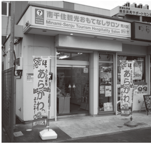
南千住観光おもてなしサロン

昨年9月、南千住駅東口ドノウ広場に「観光おもてなしサロン」という名称で観光案内所が開設。まだ利用者は少ないが、外国人観光客に荒川の観光文化情報や、飲食店やゲストハウス等の案内を行っている。 また、翌10月には日暮里駅構内の京成北口構内にもう一ヶ所、観光案内所が開設。観光情報だけでなく荒川区の商店街の魅力を紹介する拠点としても期待したい。