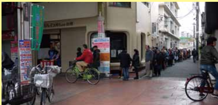
三の輪銀座商店街(午前9時55分撮影)