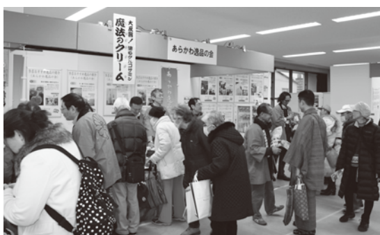
昨年の産業展でのPRコーナー

『あらかわ逸品の会』は、3月11日(土)、12日(日)に開催される第38回荒川区産業展において、参加10店舗が結束して創り出した新商品・新サービスを披露します。「一店逸品運動」とは、個店が他店にはない魅力的な商品等を開発・発掘し、お客様にPRすることによって、新規顧客の開拓やリピーターの増加に繋げ、個店の活性化とともに商店街全体の賑わい創出を図る取り組みです。