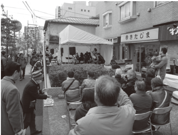
道灌山通り商和会の特設ステージ