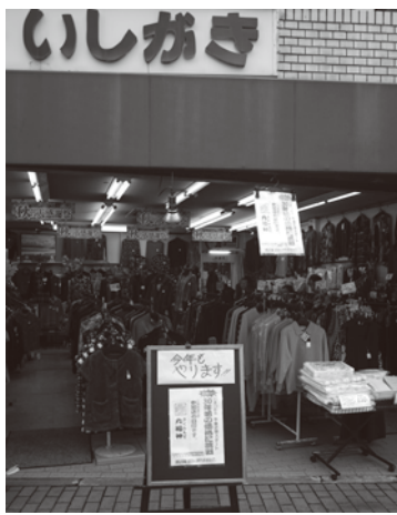
九福神イベントの告知をするお店

昼食は最寄の川崎コリアンタウンで焼き肉ランチ、その後、花王(株)川崎工場を見学し、連携広域事業のパートナーとなる台東区浅草のホテルニュー漁眠荘で懇親会を開催、視察を打ち上げた。