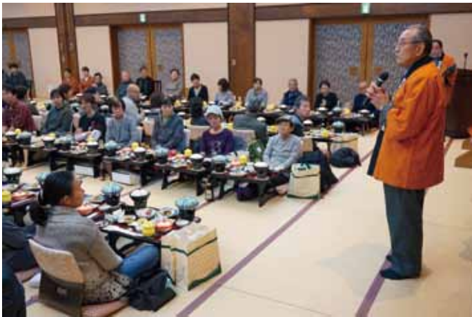
鴨川温泉・鴨川館での宴会

平成28年度商業感謝まつりの当選 景品、日帰りバス旅行（鴨川温泉） と明治座観劇招待が下記の日程で好 評のうちに実施された。今回の明治 座観劇は2月11日（土・祝）、11 5組230名のご招待。バス旅行は 2月19日（日）と26日（日）の2日（各 バス3台）に分けて実施。招待数は 各115組230名、今年度のバス