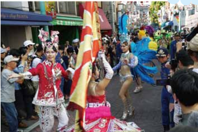
熱気いっぱい 商店街は ラッシュアワー

7/30(土) pm4:00~pm8:30 はっぴいもーる熊野前(熊野前商店街(振))