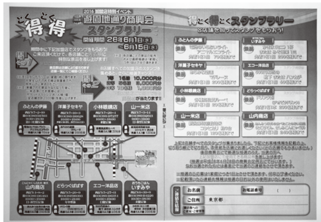
ちらし表面、スタンプラリーイベント紹介