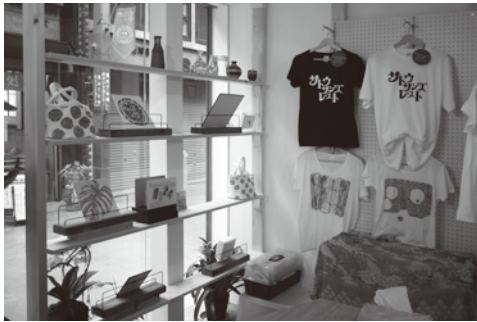
ジョイフル三の輪ロゴに合わせたオリジナルロゴ入りのTシャツ