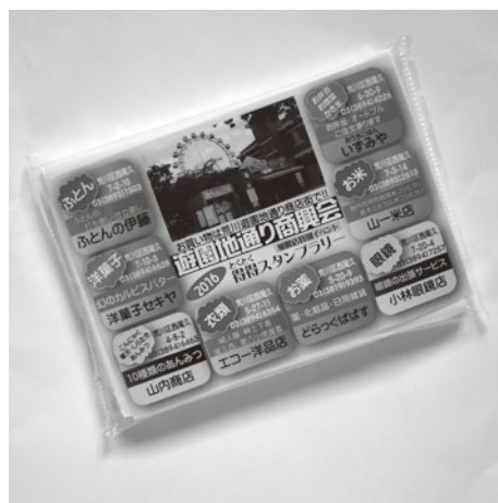
イベントPR用ポケットティッシュ

商店街を取り巻く環境が厳しくなるなか、単に組織拡大でなく、こういう形での商店会運営もあると理解して頂きたいとお話しされた。