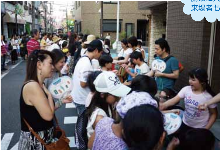
じゃんけんの 勝敗に大歓声！ 来場者も国際的