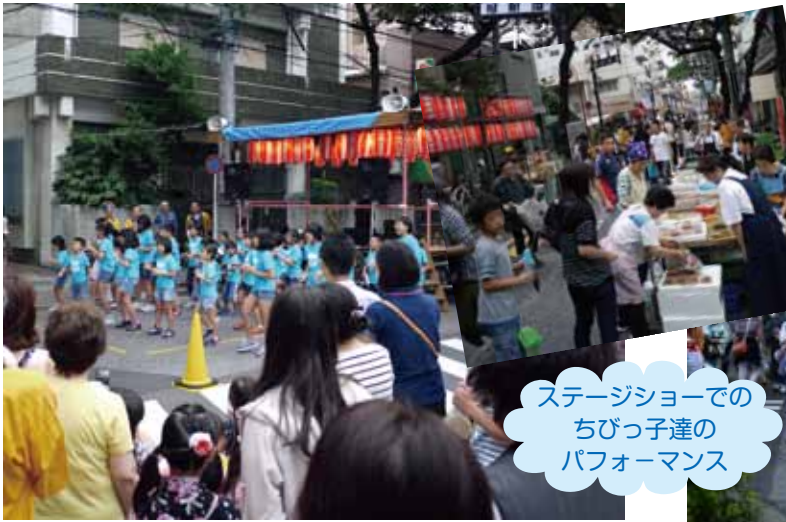
ステージショーでの ちびっ子達の パフォーマンス

23日はダンスやライブショー、24日の盆踊りには西川区長も駆けつけた。踊りに参加の先着400名に荒川区共通お買い物券進呈、麦茶無料サービス、先着500名のお子様にお菓子プレゼントがあった。