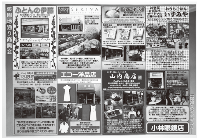
ちらし裏面、参加店PR内容