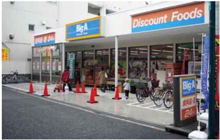
平屋1階建てのビック・エー荒川三丁目店

ビック・エーはフルタイムの「24時間営業」と「家計応援特価」がお店のセールスポイント。商品数を500品目以上揃え、食料品・日用品のディスカウントストアとして、特価品を新聞折り込み等でPRしている。