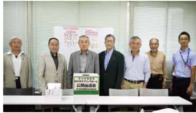
今回、厳正な抽選会をおこなった区商連役員、区役所担当者

4月29日に開催された川の手スプリングセールの大抽選会で当選したが、引換期日の5月31日までに受け取りがなく、当選が無効となった1等五万円3本、2等一万円15本、3等三千円90本を対象に、6月13日午後3時に区役所会議室で行われた。再抽選は区産業振興課長始め商連役員が立ち会い、4月29日の抽選会ではずれだった券のなかから厳選な抽選が行われ、幸運な当選者にお買い物券が郵送された。