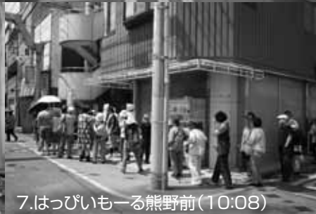
7.はっぴいもー熊野前(10:08)