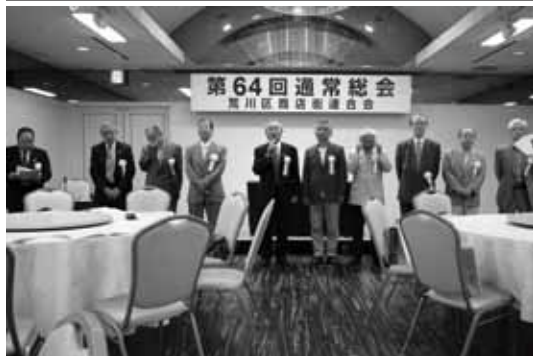
総会で紹介された荒川区商店街連合会の新役員