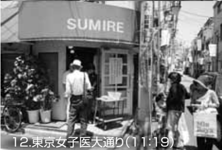
12.東京女子医大通り(11:19)