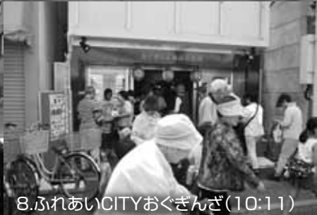
8.ふれあいCITYおぐぎんざ(10:11)