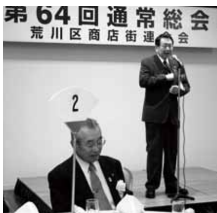
総会で挨拶される西川太一郎区長

情溢れる環境に優しいまち荒川区」をこれからの世代に引き継ぐために、ご出席の商店街の皆様と心を携えていく等のお言葉を頂いた。その他、斉藤泰紀区議会議長、松島みどり衆議院議員等、多くの方々への応援メッセージを頂き、なごやかな雰囲気の中閉会した。