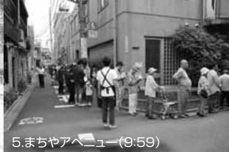
5.まちやアベニュー(9:59)