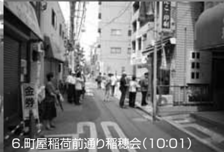
6.町屋稲荷前通り稲穂会(10:01)