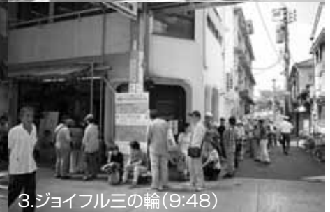
3.ジョイフル三の輪(9:48)