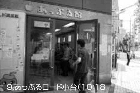
9.あぶるロード小台(10:18)

5月31日午前10時、プレミアム付きお買い物券が荒川区内の各商店街で一齐に発売された。販売当日の10時前後の様子を右上から時系列順に掲載！(各写真のクレジットは場所と撮影時間)