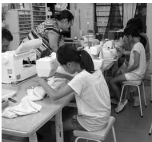
ハンドタオル・シュシュ製作講座