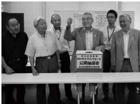
抽選会に立ち会った区商連役員、区役所担当者

抽選は区産業振興課長始め商連役員が立ち会い、3等当選での住所・氏名等の連絡先が記載されている当選券の中から、厳選な抽選が行われ、ダブル当選となった幸運な方々にお買い物券が郵送された。