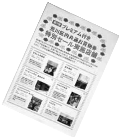
特別セール実施店紹介チラシ

下記に掲載した表がその内容である。お買い物券を活用し「地元あらかわを商店街から元気に」を共通テーマに、参加のお店が「プレミアムお買い物券発売イベント」の効果を引き出す活動をスタートさせた。プレミアム付きお買い物券に対応した特別セールは、取り組むお店が多い程、大きな効果が生まれる。今回、実施された内容についての効果や、先進事例の研究も課題となるのではないだろうか。