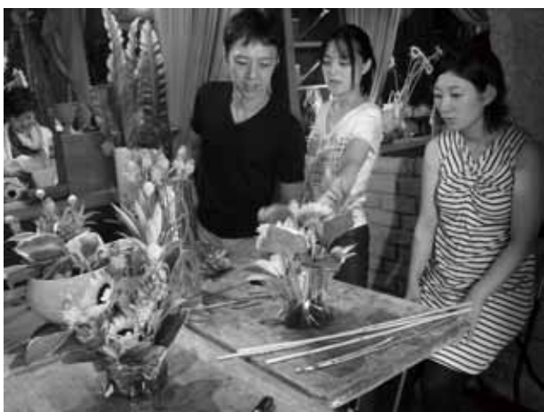
フラワーアレンジメント講座

受講者の皆様からは、「子供と一緒に楽しく参加でき、大変満足した。」「職人の技術を間近で見ることができ、子供にも良い経験になった。」「次回も講座を受けてみたい。」「沢山の感想が寄せられている。また、参加店からは、「新たなお客様の開拓につながった。」「普段聞けない、お客様の生の声が聞けた。次回、工夫してみたい。」など、この取り組みの効果を実感するとともに今後の自店の改善につながる前向きな話が聞かれている。