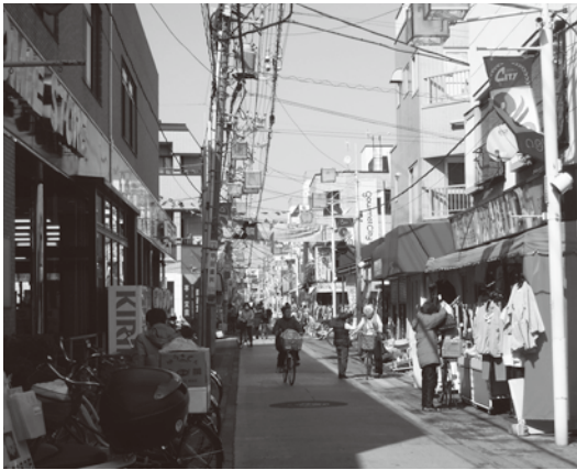
買い物客で賑わうおぐぎんざ商店街