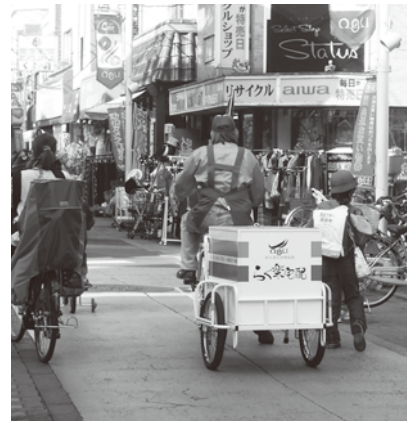
配達中のおぐぎんざ宅配リヤカー