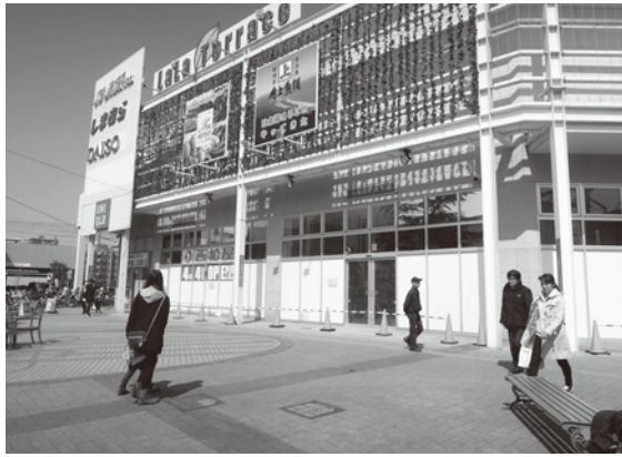
ツタヤはこの建物1階にあった。写真左下には西松屋4月4日オープンのお知らせも(3月17日撮影)

南千住駅前のツタヤ・ララテラス店が2月27日で撤退した。そのあとには、東京スターメガネ、西松屋（子ども服）、駄菓子や「ちいぶす」の3店が4月4日に開店する。