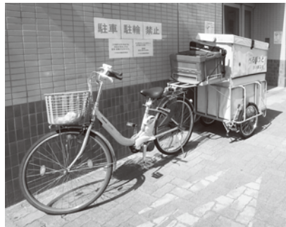
べるぼうとの宅配用 リヤカー付き自転車