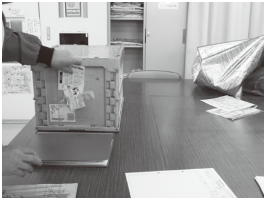
依頼者別に宅配商品を入れるべるぼうと・三徳の通い箱 依頼者の宅配カードや配達伝票を入れるポケットも

べるぼうとでも、食品スーパーの三徳汐入店が多数を占める（べるぼうと、高山治男理事長）。曜日別では、日曜、土曜、水曜（三徳のポイントカード5倍の日）が多い。