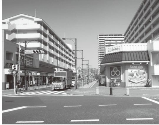
大型団地内にあるべるぼうと汐入商店街