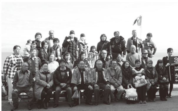
晴天の駿河湾をバックに記念撮影(焼津で)

た。昼食もよかった」と感謝の声を添乗の役員に寄せる参加者も多かった。帰りの道路はがらすきで、荒川区には30分以上早く着き、全員無事に帰宅の途に着いた。