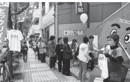
↑小台大通り振組の「秋の味覚まつり」抽選会では、あまちゃんTシャツなどの景品を展示

選会(事前に1～2週間抽選券進呈セール)、環境や交通安全・防犯・防災の啓発など。