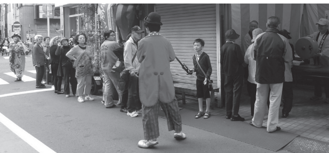
▲ミニイベントとして、ピエロなどの扮装をした大道芸人が抽選に並んだお客さんを楽しませていた (小台橋みずぎ通りで)