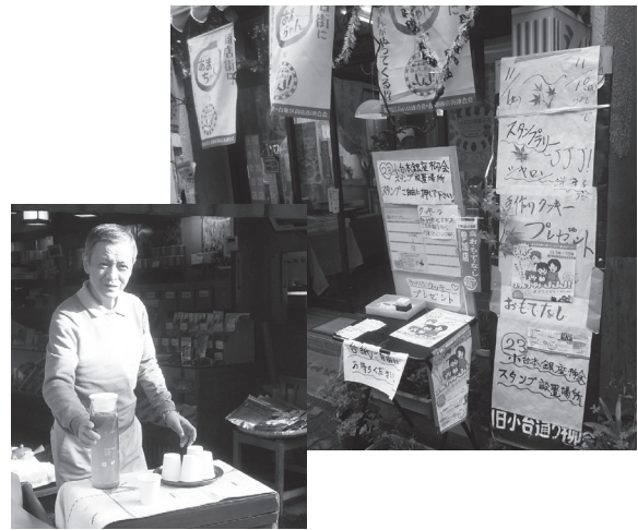
▲「スタンプラリー-JJJ! 食お・も・て・な・し」では、ラリー参加者にお菓子やお茶でおもてなしをする会も多かった (小台本銀座柳会は手作りクッキーを進呈=洋菓子店シャロン店頭=写真右上。熊野前商店街はお茶を振る舞った=お茶の前田園)