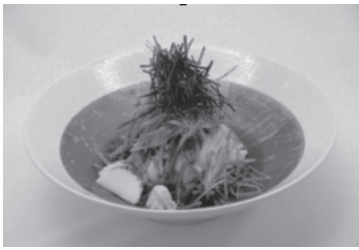
平塚逸品研究会 創作うどん店