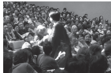
◀観客席で気軽に冗談を交わす美川憲一に笑顔で見入る観衆 (歌の祭典で)