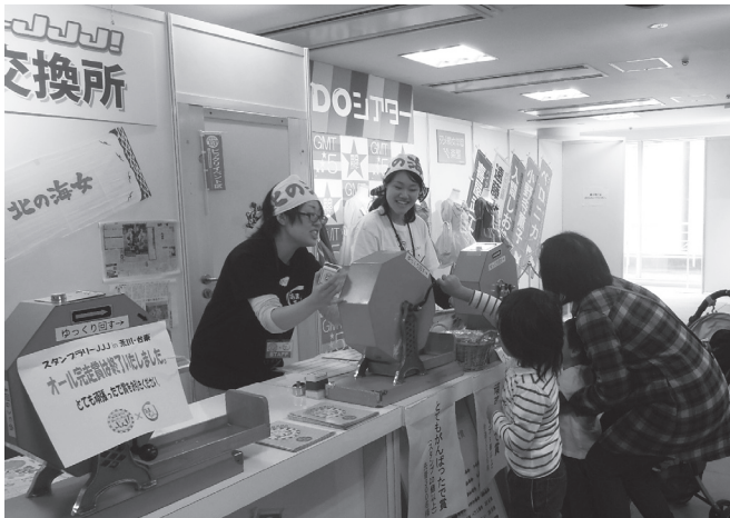
▲アメ横センタービルに設けられたあまちゃんセット内の抽選会場。41 商店街を完走した人は数日で定数の 100 名に達した