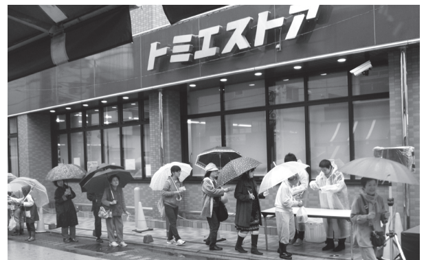
おぐぎんざ振組の抽選会では、予め整理券が配られ、多くの人が列を作った↓

愛称公募に90通の応募 「かわいいデザインができたのだから」と、愛称を公募したところ、約90通の応募があり、西尾久在住の女性が考えた「お宮ちゃん」と決定した。同商店街ではこのデザインを入れたフラッグを作成、役員の名刺に取