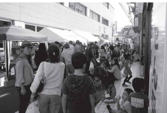
↑女子医大通り宮前商店会の「宮前わくわくコミュニケーション」。昨年に続き2回目

内容としては、子ども・家族向けのゲーム、模擬店、秋の味覚や区内共通お買い物券等の景品が当たる抽