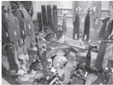
青森市新町商店街 振興組合 刃物店