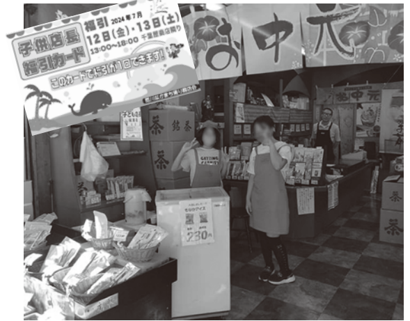
荒川なかまち通り商店会の職業体験の子ども店長と名刺カード