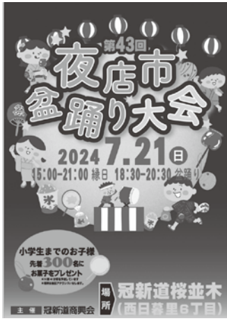
冠新道商興会のイベントポスター

7月21日(日)コロナ自粛以来5年ぶりに夜店市&盆踊り大会を開催。再開を待ちわびた来場者で会場はあふれた。飲食や子どもゲームなどの模擬店が商店街の通りに立並び、盆踊りも元三島神社五神太鼓保存会の勇壮な祭り太鼓が華を添えた。