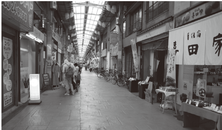
長い直線が印象的なジョイフル三の輪アーケード

現在、ジョイフル三の輪は荒川区唯一のアーケードのある商店街だが、直線距離では都内有数の約400メートルを誇る。長さを活かした移動しながらの長いシーンも撮影可能、また、撮影する時間も日中から深夜まで内容に合わせて便宜を図るなど、商店街側の制作協力も徹底している。