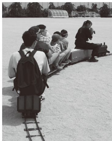
ミニ列車の乗車体験も親子で参加