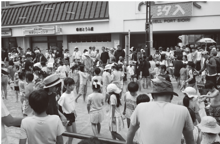
特設プールでのべるぼうとのどじょうつかみ大会イベント

昭和のレトロ感にあふれた懐かしいイメージと、派手な自己主張の店も少ないことで、制作側がドラマの舞台としてさりげなく使える撮影場所として選ばれているようだ。 この数年は映画やTVドラマの他、各種の映像シーンでの撮影依頼は80件を下回ることではなく、今後も毎年増える傾向にある。