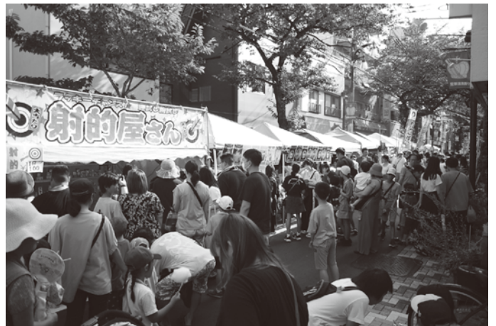
冠新道商興会の夜店市風景