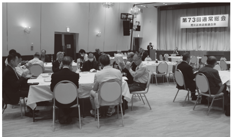
第73回 区商連総会での議事の様子