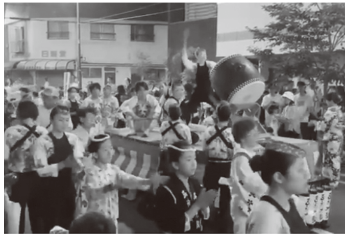
冠新道商興会の盆踊り(五神太鼓、YouTubeより)