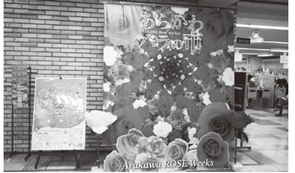
荒川区役所玄関ロビーの催事案内