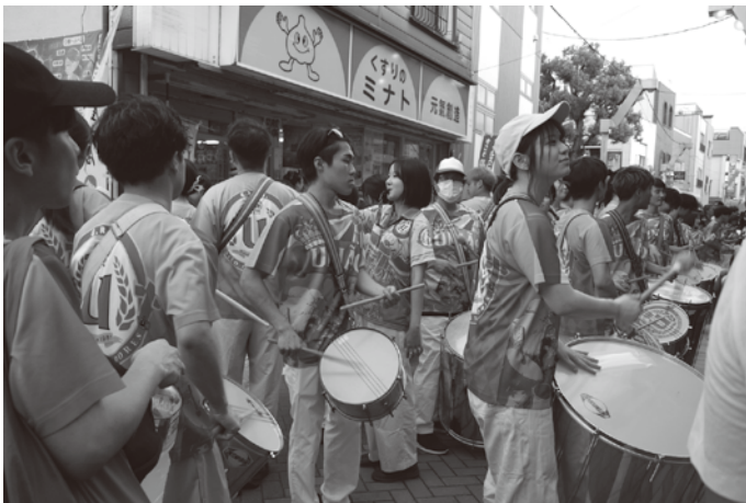
商店街をサンバ楽隊の若者たちが躍動