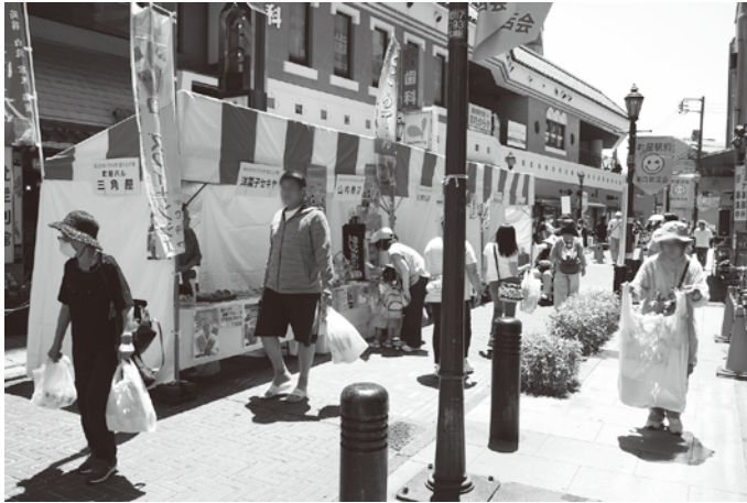
商店街会員も出店