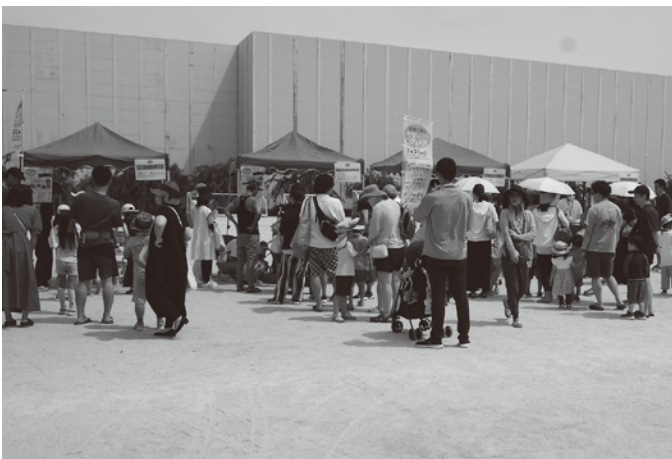
輪投げやスマートボール、射的等の子ども縁日の行列

旭電化通り商光会振組では7月28日(日)に東尾久運動場多目的広場でサマーフェスタを開催した。ミニ列車の体験乗車やふれあい動物園、子ども縁日など多くの催しを実施。セールで配布の豪華景品の当たる抽選会もあり、猛暑の中、多くの家族連れで賑わった。