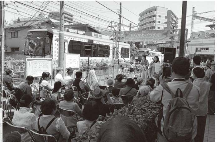
町屋駅周辺での演奏会