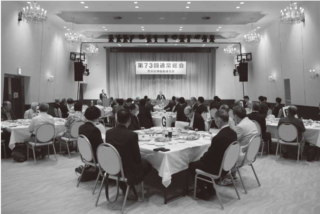
第73回荒川区商店街連合会通常総会後の懇親会のようす