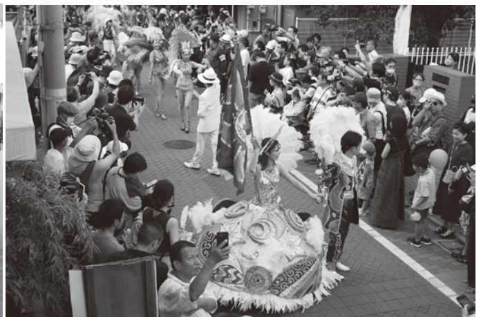
サンバパレード先頭での賑やかなパフォーマンス