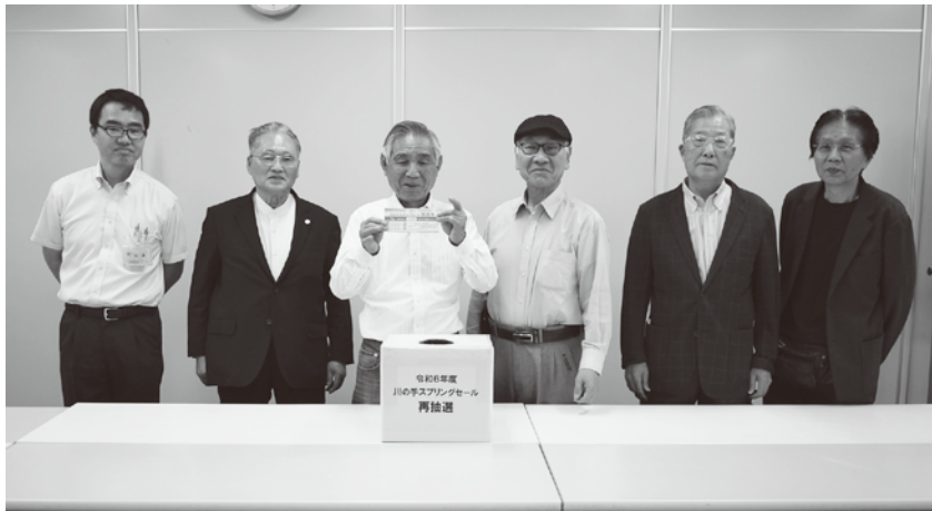
区担当者の立ち会いの元、区商連役員で厳正な再抽選を実施

令和6年度のスプリングセールの再抽選は区担当職員の立ち会いと区商連役員で6月7日に実施。今回は1等3本を含む総数141本を再抽選し、直ちに当選者に賞品が郵送された。抽選券進呈の際、抽選発表日や当選番号の確認を「忘れずしましょう」のお声掛けもお願いします。